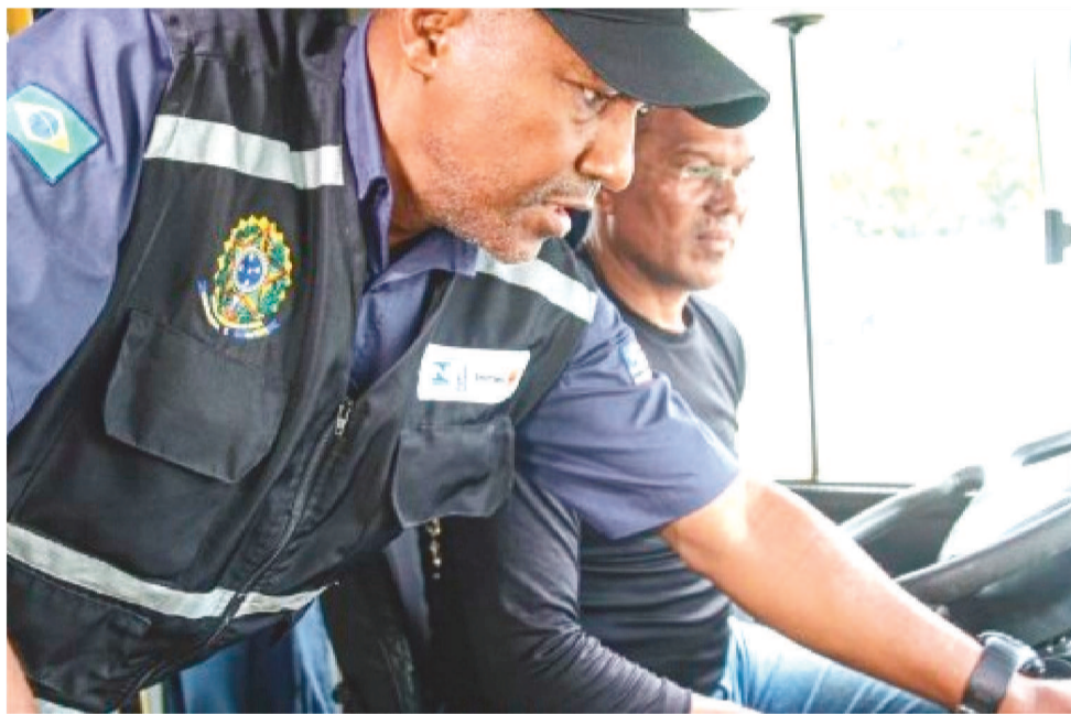
CRONOTACÓGRAFO É CONSIDERADO A “CAIXA-PRETA” DOS VEÍCULOS DE TRANSPORTE