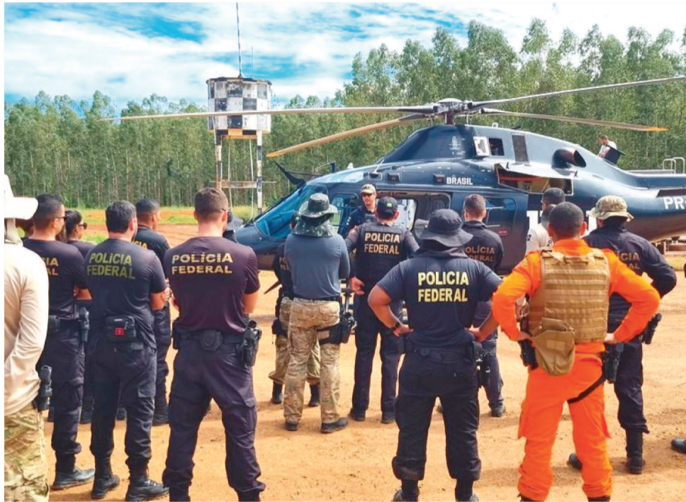
AO TODO, ESTÃO PARTICIPANDO DA OPERAÇÃO 65 POLICIAIS FEDERAIS

No primeiro dia, houve a prisão em flagrante de 12 pessoas responsáveis pelo plantio ilícito de maconha. No local da prisão, foram eliminados mais de 7 mil pés de maconha, em uma área de cerca de 7.680 m 2 , o que equivaleria a aproximadamente 2,5 toneladas de drogas, tendo havido ainda a apreensão de maconha pronta, equipamentos de prensa de drogas