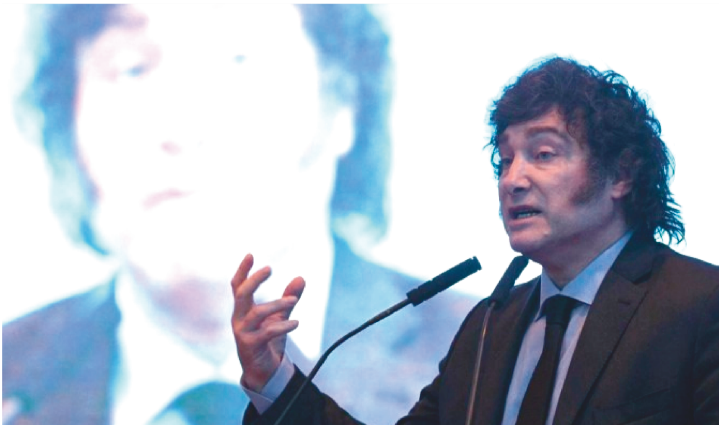
JAVIER MILEI, INSULTA O LÍDER DA COLÔMBIA, GUSTAVO PETRO, DURANTE UMA ENTREVISTA À REDE DE TV CNN ESPANHOLA

Diplomatas argentinos na Colômbia serão expulsos do país, determinou o Ministério de Relações Exteriores colombiano. A iniciativa da pasta ocorreu após o presidente da Argentina, Javier Milei, insultar o líder da Colômbia, Gustavo Petro, durante uma entrevista à rede de TV CNN espanhola. Aos jornalistas, Milei chamou Petro de “assassino e terrorista”.