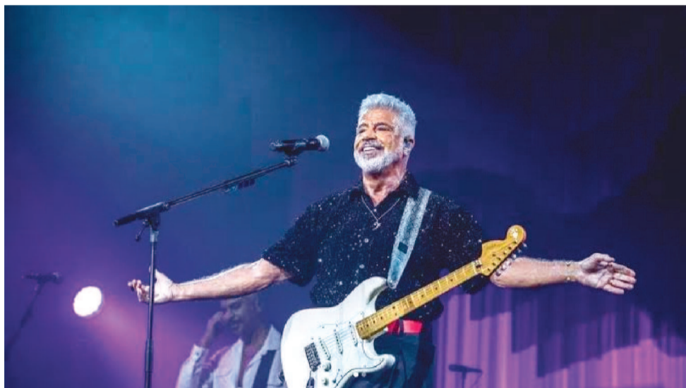
LULU SANTOS OLTA A SÃO LUÍS, APÓS 11 ANOS DO ÚLTIMO SHOW NA ILHA DO AMOR

também mantém uma atuação de destaque na televisão brasileira. Quando o celebrado programa "The Voice" chegou ao Brasil em 2012. Com 10 milhões de discos vendidos, os tempos modernos acompanham sua magnitude, totalizando mais de 1 bi-