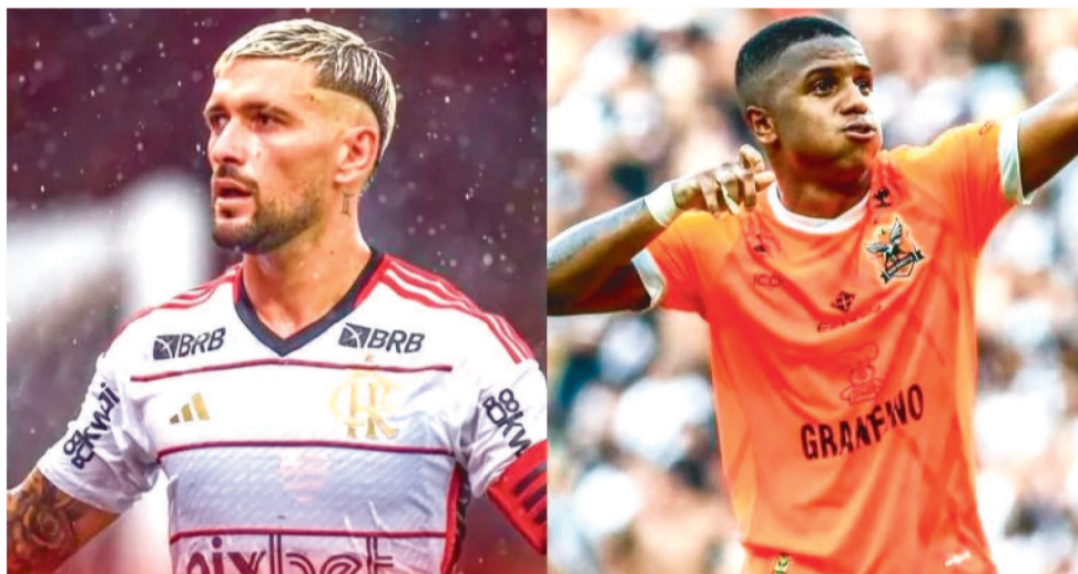
FLAMENGO E NOVA IGUAÇU DUELAM NESTE SÁBADO E NO PRÓXIMO DIA 7 DE ABRIL