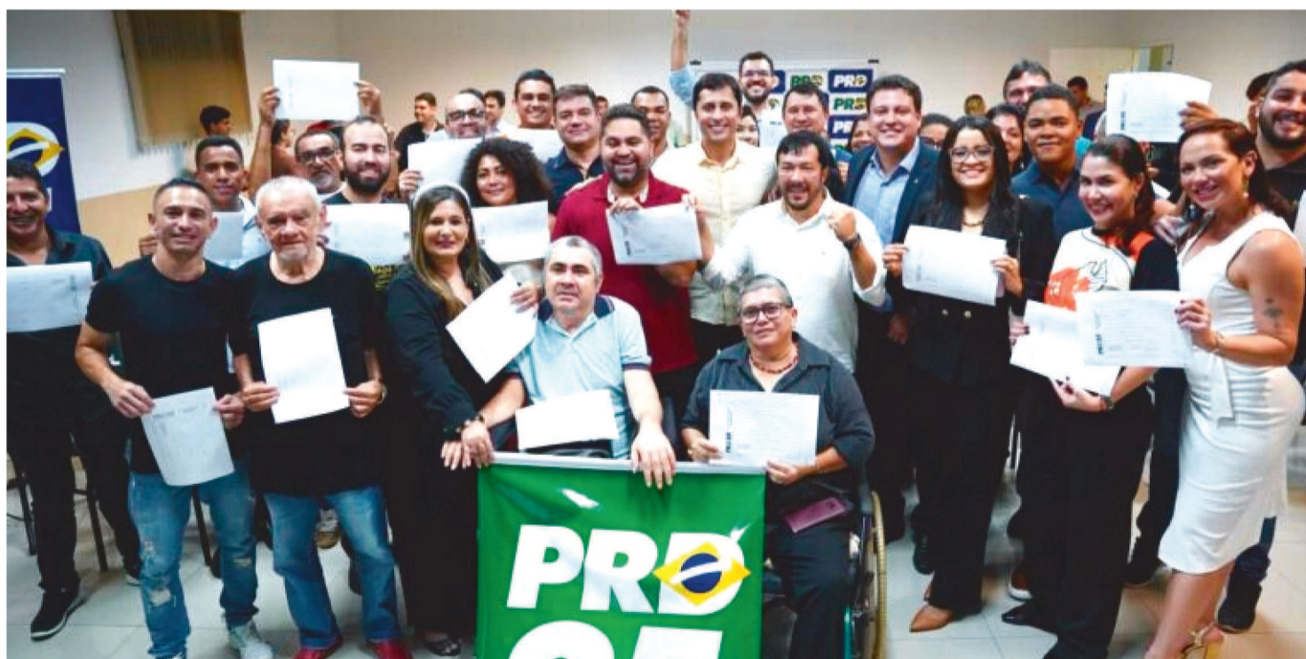
DURANTE EVENTO, DEPUTADO MARRECA FILHO RESSALTOU A QUALIDADE PARLAMENTAR DE DUARTE JR NA CÂMARA FEDERAL

O Partido Renovação Democrática (PRD) reuniu pré-candidatos a vereador na noite desta quinta-feira (14), em São Luís, para oficializar o apoio à pré-candidatura do deputado federal Duarte Jr. (PSB) a prefeito de São Luís.