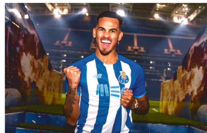
Maranhense Galeno foi convocado para a vaga de Gabriel Martinelli, do Arsenal

Gabriel Magalhães é o quinto nome cortado por Dorival Júnior de sua lista inicial. Antes, o técnico da Seleção foi obrigado a tirar o goleiro Ederson, o zagueiro Marquinhos, o atacante Martinelli e o volante Casemiro, todos lesionados. O treinador chamou o maranhense Galeno (Porto) Léo Jardim (Vasco), Fabrício Bruno (Flamengo), e Pepê (Porto) para as vagas.