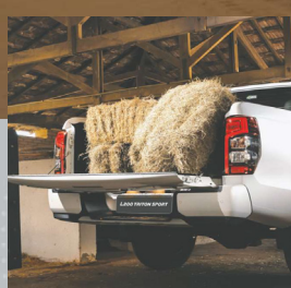
CAPACIDADE DE CARGA DE 1 TONELADA