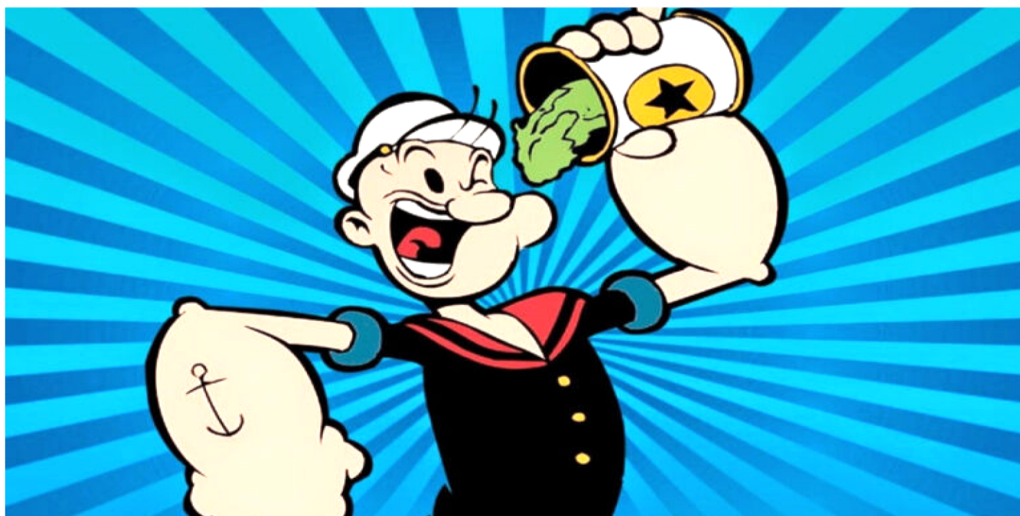
MARINHEIRO TERÁ NOVO FILME APÓS SUCESSO DE 1980. NOVA PRODUÇÃO DEVE VIR PARA COMEMORAR 100 ANOS DO PERSONAGEM

Popeye, o icônico marinheiro e comedor de espinafre, que apareceu pela primeira vez em histórias em quadrinhos no final da década de 1920, vai ganhar um filme em live-action.