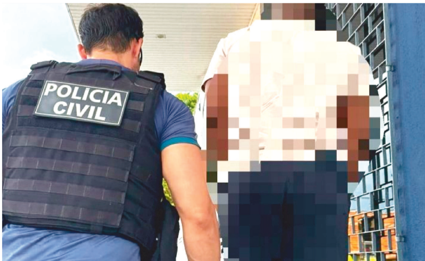
O SUSPEITO UTILIZOU AJUDA DA IRMÃ PARA DESVIAR CERCA DE MEIO MILHÃO EM APENAS SEIS MESES DA EMPRESA QUE TRABALHAVA

No bairro do Angelim, em São Luís, a Polícia Civil do Maranhão, em uma ação realizada, deu cumprimento a um mandado de prisão preventiva contra um homem investigado pelo crime de furto qualificado em continuidade delitiva. De acordo com as investigações da Delegacia de Roubos e Furtos (DRF/SPCC), o homem desviou mais de R$ 450 mil no período aproximado de seis meses da empresa onde trabalhava.