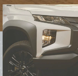
DETALHES EXTERNOS EM GRAFITE FOSCO