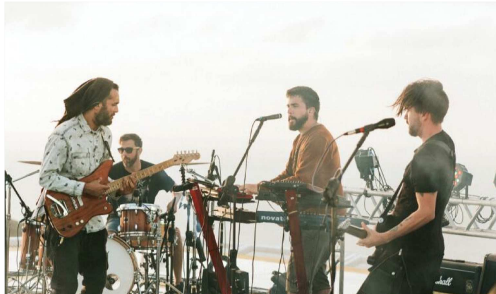
COM O GALAXY SPECIES, A BANDA VENCEU A 1ª EDIÇÃO DO EDP LIVE BANDS BRASIL

Com as canções do Galaxy Species, a Souvenir venceu a primeira edição do EDP Live Bands Brasil, cujo prêmio foi tocar no NOS Alive 2016, em Portugal, junto de nomes como Radiohead, Tame Impala e Arcade Fire. Fizeram