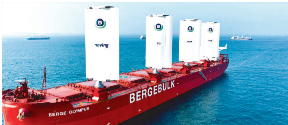
O NAVIO BERGE OLYMPUS POUPA CERCA DE 6 TONELADAS DE COMBUSTÍVEL

A Vale está comprometida em apoiar a indústria marítima para atingir as metas de descarbonização da Organi-