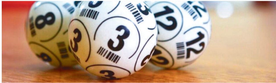
EMPRESAS CONCESSIONÁRIAS OFERTARÁ QUATRO MODALIDADES DE JOGOS AO PÚBLICO

Neste primeiro momento, a Lotema, por meio das empresas concessionárias, ofertará quatro modalidades de jogos ao público, sendo eles o Prognóstico Número, Prognóstico Específico, Loteria Instantânea e Apostas de