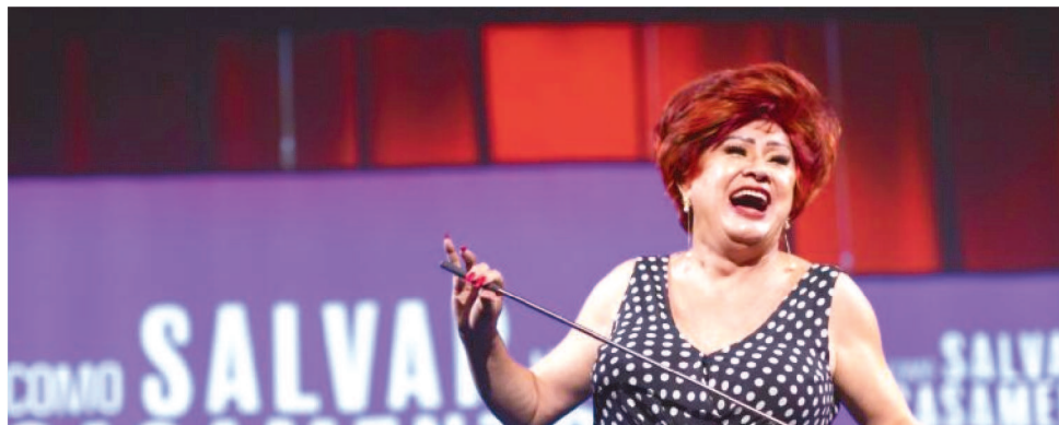
A PEÇA ORIGINAL FEZ GRANDE SUCESSO E RODOU TODO O PAÍS HÁ 15 ANOS

"Quando o texto foi escrito, ele foi inspirado na separação dos meus irmãos. Hoje, eles estão casados de no-