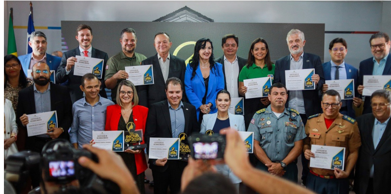
O Instituto de Previdência dos Servidores do Estado do Maranhão (Iprev) foi premiado em 1º lugar na categoria de Projetos de Iniciativas inovadoras Implementáveis

"Um dia de muita alegria, em primeiro, porque a Egma passa a ser considerada uma fundação, uma oportunidade para avançar na capacitação dos servidores. E aqui, o Iprev recebe o 1º lugar com um dos nossos grandes projetos, que é o Simpliprev, buscando trazer uma linguagem acessível a todos os beneficiários da Previdência estadual.