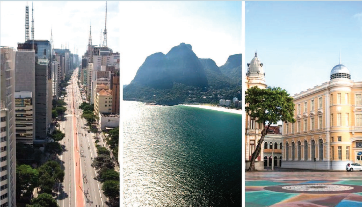
Site KAYAK aponta São Paulo, Rio e Recife como os destinos mais procurados no feriado de Corpus Christi. Crédito: MTur Destinos

A Universidade Ceuma foi palco recentemente do V Simpósio de Emergências Cardiológicas da Lacardio, uma promoção da Liga Acadêmica de Cardiologia da Universidade Ceuma. O evento que reuniu estudantes de medicina e profissionais da área de saúde em busca de conhecimento atualizado sobre o manejo de emergências cardíacas. Graças ao patrocínio do Laboratório Lacmar e de outros parceiros, o Simpósio contou com a participação de renomados cardiologistas da região, proporcionando um ambiente de intenso aprendizado e troca de experiências. Organizado pela Lacardio, esse encontro teve como principal objetivo debater e abordar os aspectos mais relevantes e atualizados no tratamento de emergências cardíacas. As palestras e mesas redondas foram conduzidas por especialistas de destaque, que compartilharam suas experiências clínicas e discutiram casos práticos, oferecendo aos participantes uma visão abrangente e detalhada sobre o tema. O Laboratório Lacmar, reconhecido pelo seu compromisso com a excelência em análises clínicas e seu apoio a iniciativas educacionais, foi um dos principais patrocinadores do Simpósio.