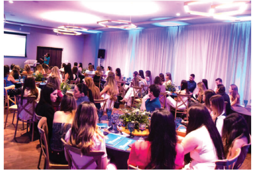
Público, formado por médicos, durante evento promovido pela Pharmapele São Luís