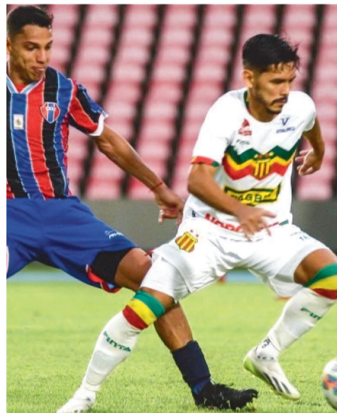
Estão fora de cogitação no time tri-