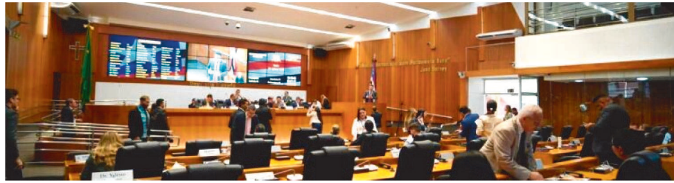
OS ACORDOS DE PARTIDOS E BANCADAS JÁ RENDERAM OUTRAS ALTERAÇÕES NA CASA