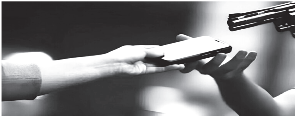
O PAÍS SERÁ O PRIMEIRO A TER OS RECURSOS INÉDITOS LIBERADOS PARA USO

Essa ferramenta de segurança verifica apps em busca de vulnerabilidades e de ameaças e vai passar a bloquear a instalação de aplicativos que