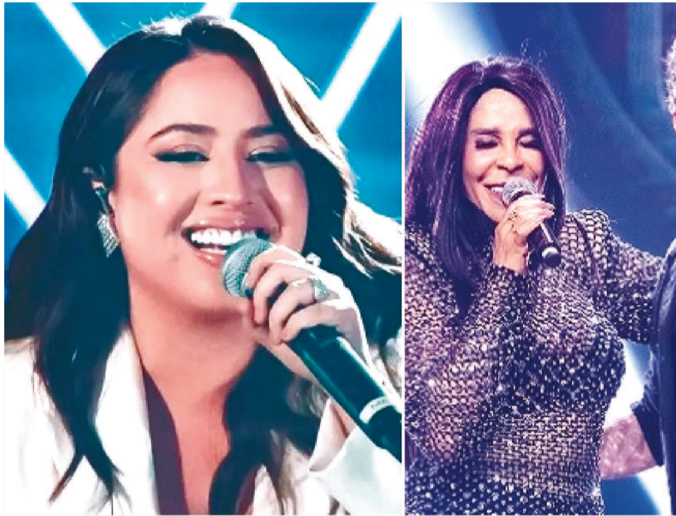
EVENTO DEVE ATRAIR MAIS TURISTAS E GERAR MAIS EMPREGO DURANTE A TEMPORADA

E nesta sexta-feira (14), se apresentam Mari Fernandez, Calcinha Preta e MC Daniel.