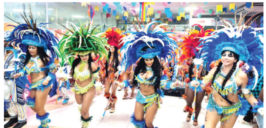
As belas índias do Boi D' Itapari, se apresentando no Arraial da Maxx