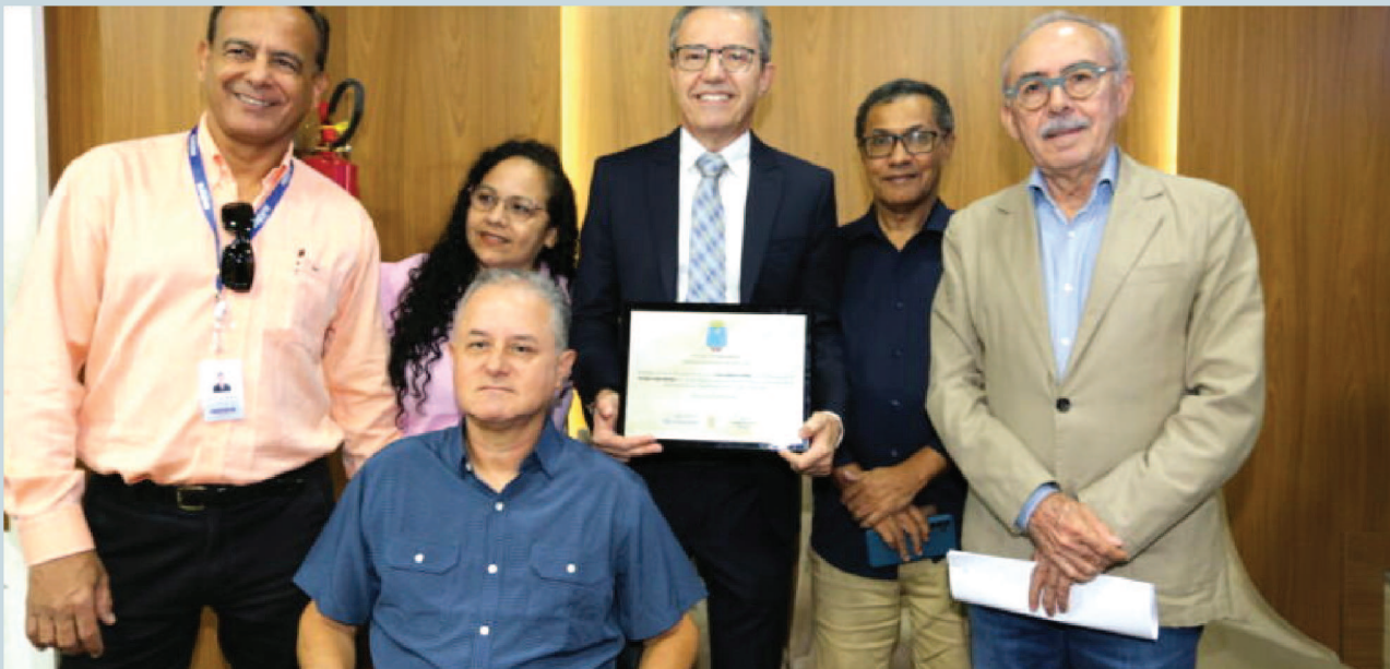
Lideranças Comunitárias prestigiaram o evento