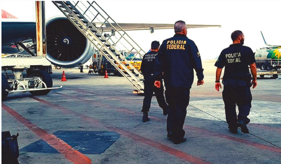
O HOMEM FOI PRESO LOGO NO DESEMBARQUE DE PASSAGEIROS E LEVADO À SEDE DA PF

A Polícia Federal cumpriu, nessa quinta-feira (20), na região metropolitana de São Luís, um mandado de busca e apreensão e um mandado de prisão preventiva em desfavor de investigado que produziu, armazenou cenas de abuso sexual infantojuvenil