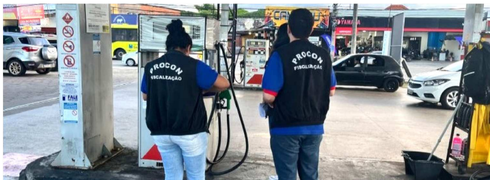
FISCALIZAÇÕES EM POSTOS FORAM INICIADAS APÓS DENÚNCIAS DE CONSUMIDORES

As fiscalizações foram iniciadas após denúncias de que alguns postos de combustíveis teriam reajustado antecipadamente o preço da gasolina, o que caracteriza prática abusiva. Além disso, há relatos de postos que aumentaram os preços além da mar-