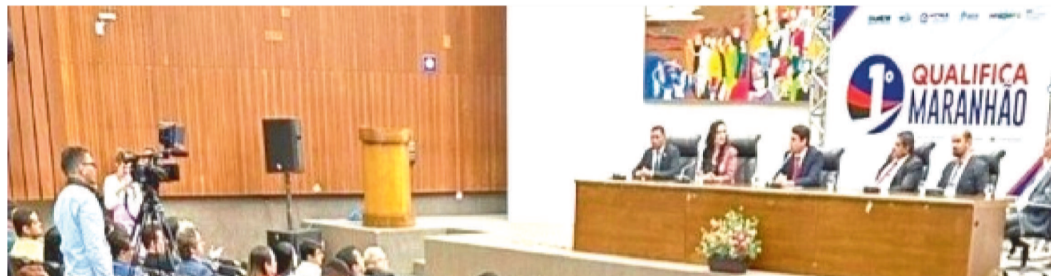
ESTE CURSO ONLINE, EM PARCERIA COM A ESCOLA DE GOVERNO DTEM INTUITO DE OFERECER UMA FORMAÇÃO DE ALTA QUALIDADE

Em uma iniciativa para atender à demanda crescente por capacitação sobre a Nova Lei de Licitações e Contratos (Lei 14.133/21), a Federação dos Municípios do Estado do Maranhão (Famem) reforça a importância para os gestores e técnicos municipais sobre a versão web do programa Qualifica Maranhão.