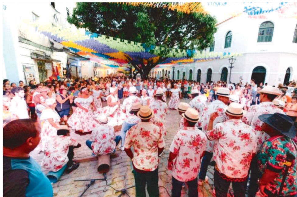
PALCO DO CANTO DA CULTURA FICA NO CANTO DA RUA PORTUGAL COM RUA DA ESTRELA

16h – Oficina de Reggae GDAM 17h – Dança Portuguesa Arco-íris de Portugal 18h – Boi Mimoso de São João do Sá Viana (M) 19h – Boi Unidos de Coqueiro (M)