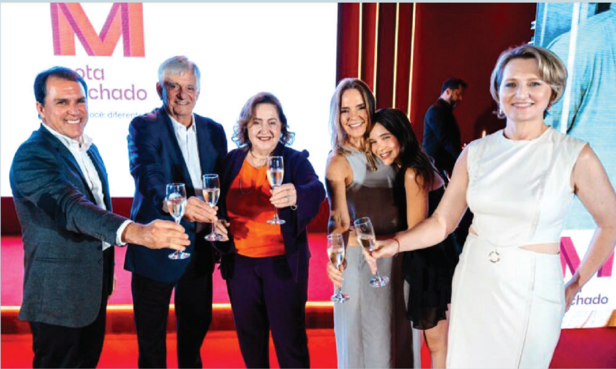
O presidente Assis Machado e diretores realizaram cerimônia na noite de quarta-feira