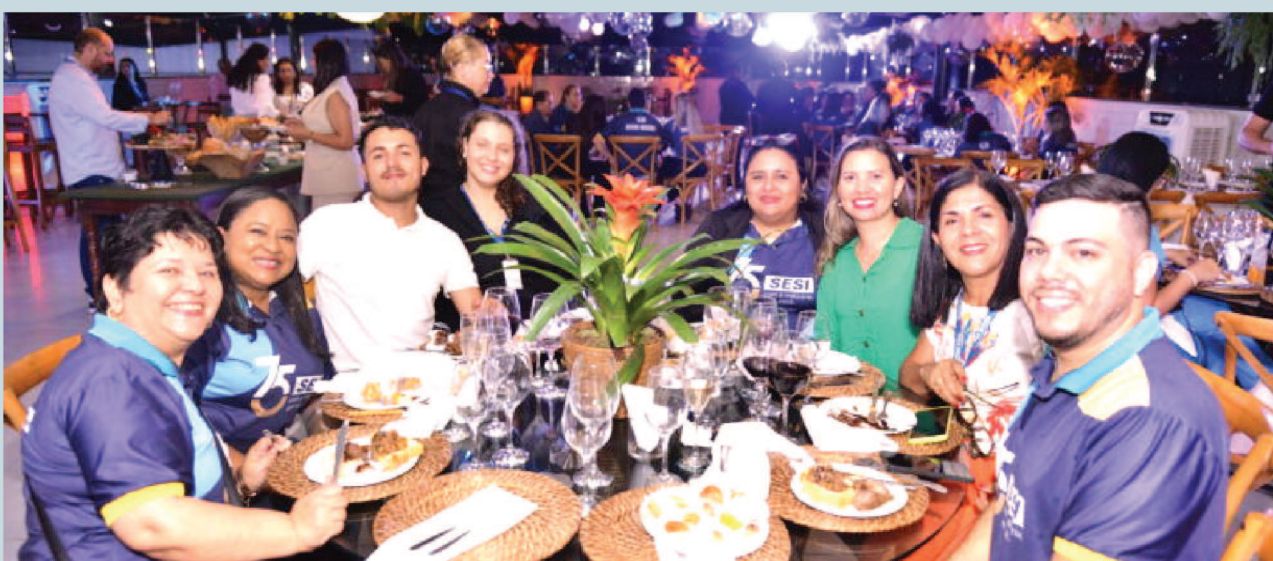
Colaboradores do SESI na festa de inauguração