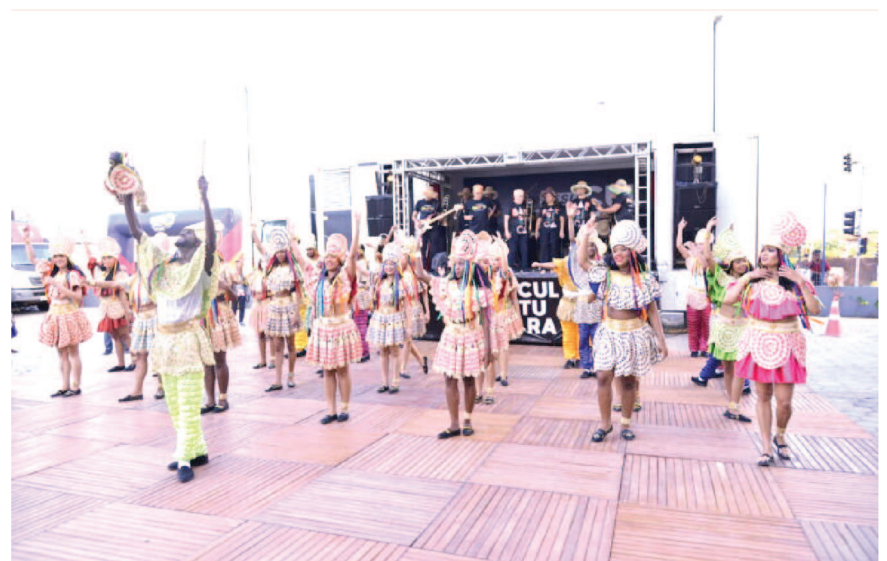
Companhia Barrica fez uma bela e animada apresentação