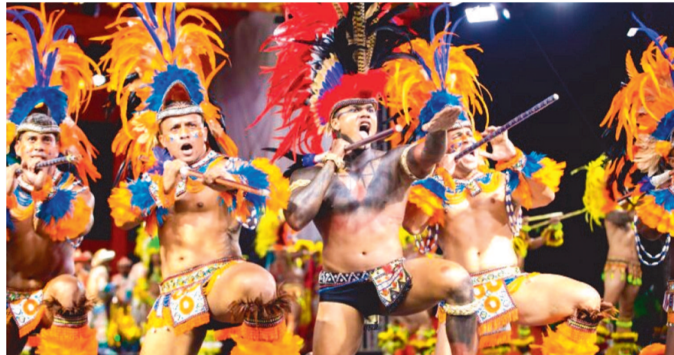
DURANTE 2 DIAS, GRUPOS ARTÍSTICOS, ARTESANATO E VARIADAS ATRAÇÕES SE REVEZAM NA PROGRAMAÇÃO

Durante dois dias, grupos artísticos, representações do artesanato e variadas atrações se revezam em uma programação que inclui barraquinhas para a venda de produtos artesanais e comidas típicas, apresentações de cordelistas, quadrilhas, danças típicas regionais, desfile de moda, além de brincadeiras, evidenciando a potência cultural dos estados do Maranhão, Ceará, Paraíba e do Rio de Janeiro.