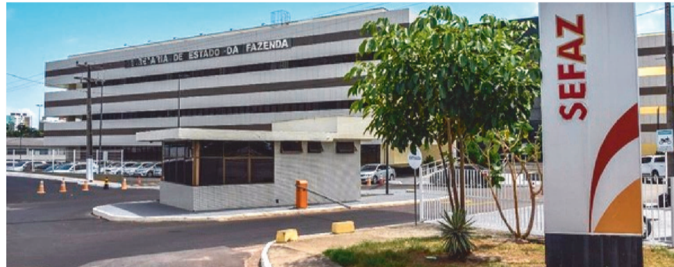
SEFAZ AUTUOU 15 EMPRESAS EM R$ 42 MILHÕES NOS ÚLTIMOS ANOS NO MARANHÃO