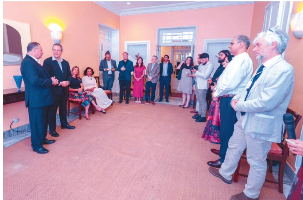
GOVERNADOR PARTICIPOU DE ENCONTROS QUE PODEM DESENVOLVER O MARANHÃO

“Estamos muito honrados com o título conquistado pelos Lençóis Maranhenses. Mas a nossa agenda não parou por aqui. Tivemos também uma agenda comercial, conversando com