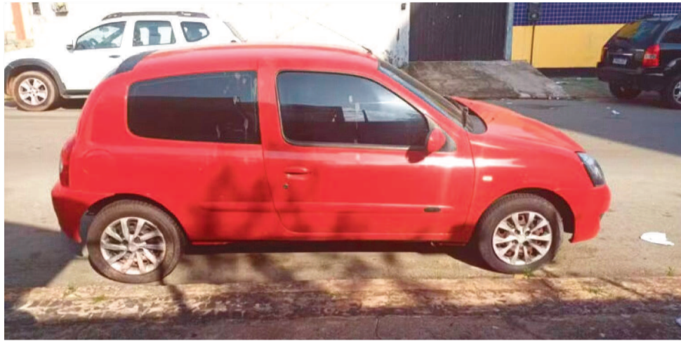
CARRO ESTÁ REGISTRADO NO NOME DE OUTRA PESSOA QUE JÁ VENDEU O VEÍCULO