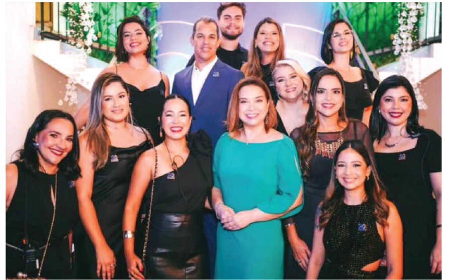
Equipe de Comunicação e Marketing do Grupo Equatorial