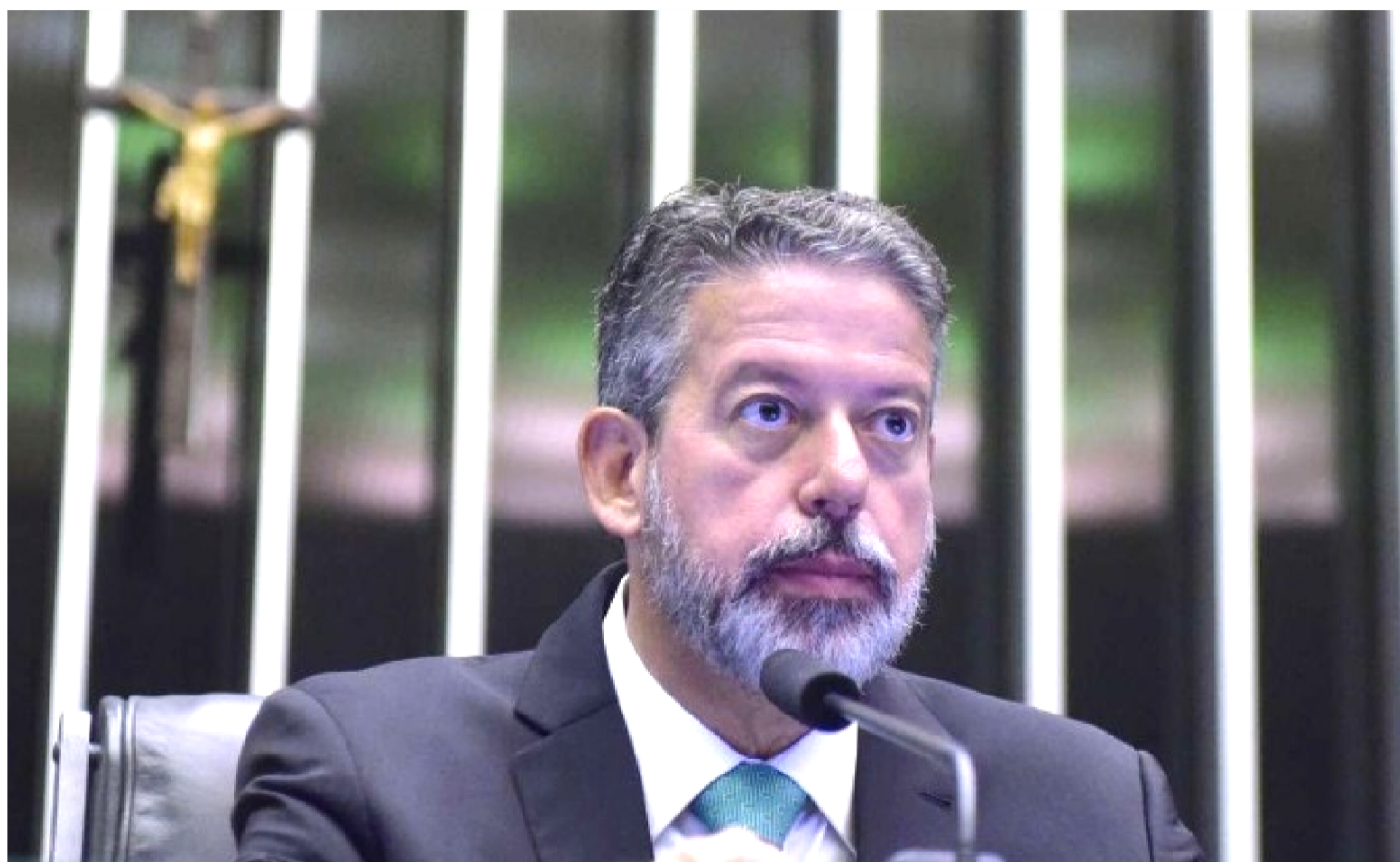
O PRESIDENTE DA CÂMARA, ARTHUR LIRA (PP-AL), AVALIA COM CONSULTORIA JURÍDICA DA CASA RECURSO QUE SERÁ APRESENTADO

O presidente da Câmara, Arthur Lira (PP-AL), e a consultoria jurídica da Casa decidiram entrar com recurso contra a decisão do ministro Flávio Dino, do Supremo Tribunal Federal (STF), que determinou auditoria nas emendas parlamentares liberadas desde 2020.