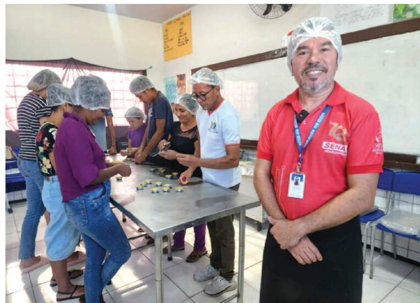
Senai estimula empreendedores com oficina de pães artesanais em Cantanhede