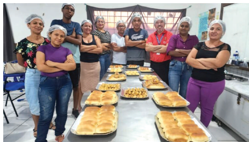
As oficinas do SENAI realizadas em Cantanhede nos dias 3 e 4 de agosto fizeram parte das ações do SESI Itinerante