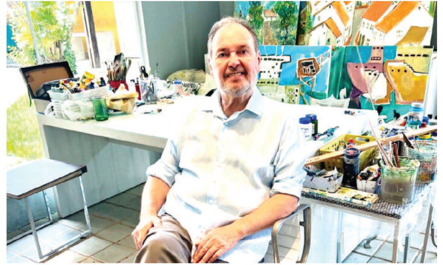
A exposição de Fernando Motta será dia 14 de agosto, no Salão Portugal- Convento das Mercês