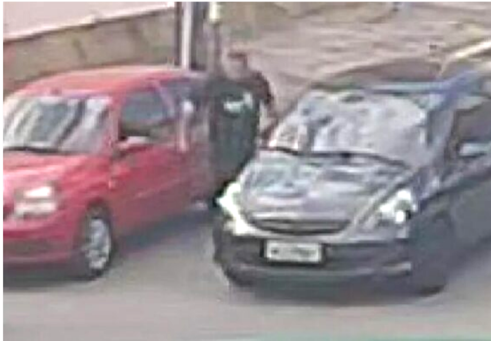
OS ENVOLVIDOS NO CASO CARRO DO MILHÃO FORAM ALVOS DE OPERAÇÃO DA POLÍCIA

Os maços de dinheiro estavam escondidos no porta-malas em frente a um condomínio, na Rua das Andirobas, no bairro Renascença, em São