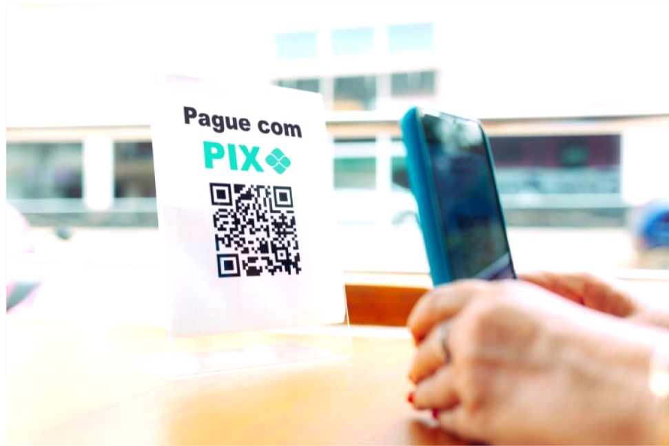
DIGITALIZAÇÃO DA VIDA FINANCEIRA É TENDÊNCIA PARA OS PRÓXIMOS ANOS