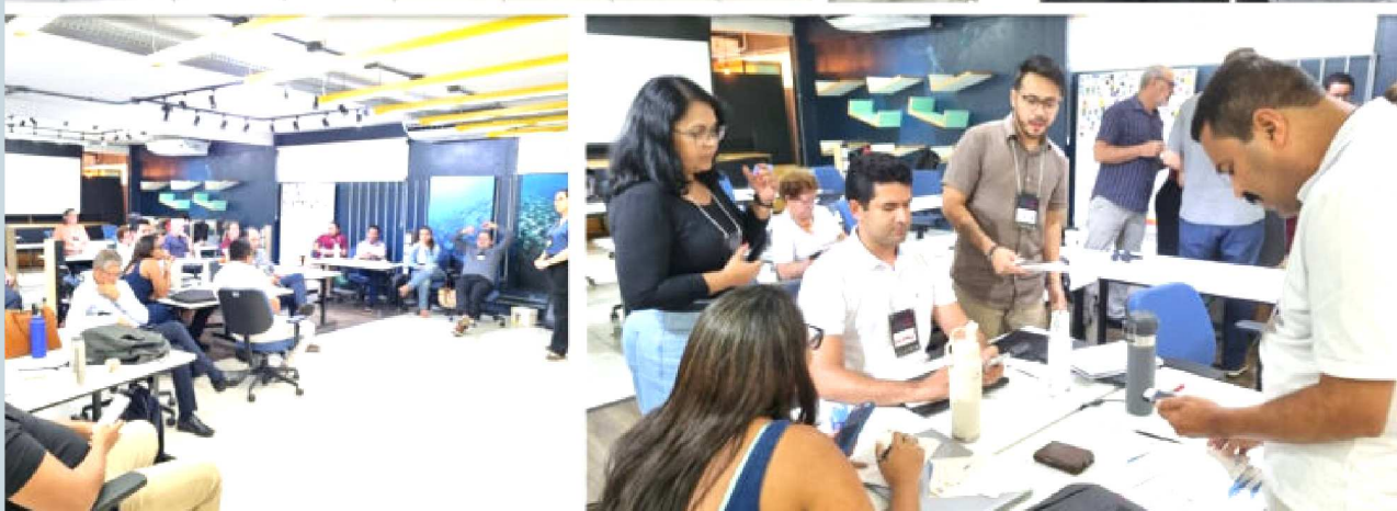
Novo Empretec Arena traz formato inovador e tecnológico do seminário de capacitação empresarial da ONU