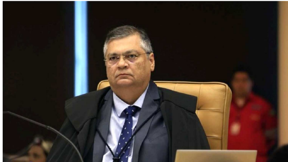
DINO RETIROU DA PAUTA A ANÁLISE DO PROCESSO DE ESCOLHA DE NOVO CONSELHEIRO

O ministro do Supremo Tribunal Federal, Flávio Dino, decidiu retirar de pauta do dia a análise do processo de escolha do novo Conselheiro do Tribunal de Contas do Estado do Maranhão (TCE-MA). Ainda não foi definida a data para que o tema volte a ser pautado e analisado pelo STF. Relator do processo, Dino impediu que o plenário da Suprema Corte iniciasse a apreciação da matéria pautada para esta sexta-feira (16) e que deveria se estender até o dia 23, onde seriam definidas as novas regras para a escolha do novo membro do TCE-MA, para a vaga aberta com a aposentadoria antecipada do conselheiro Washington Oliveira.