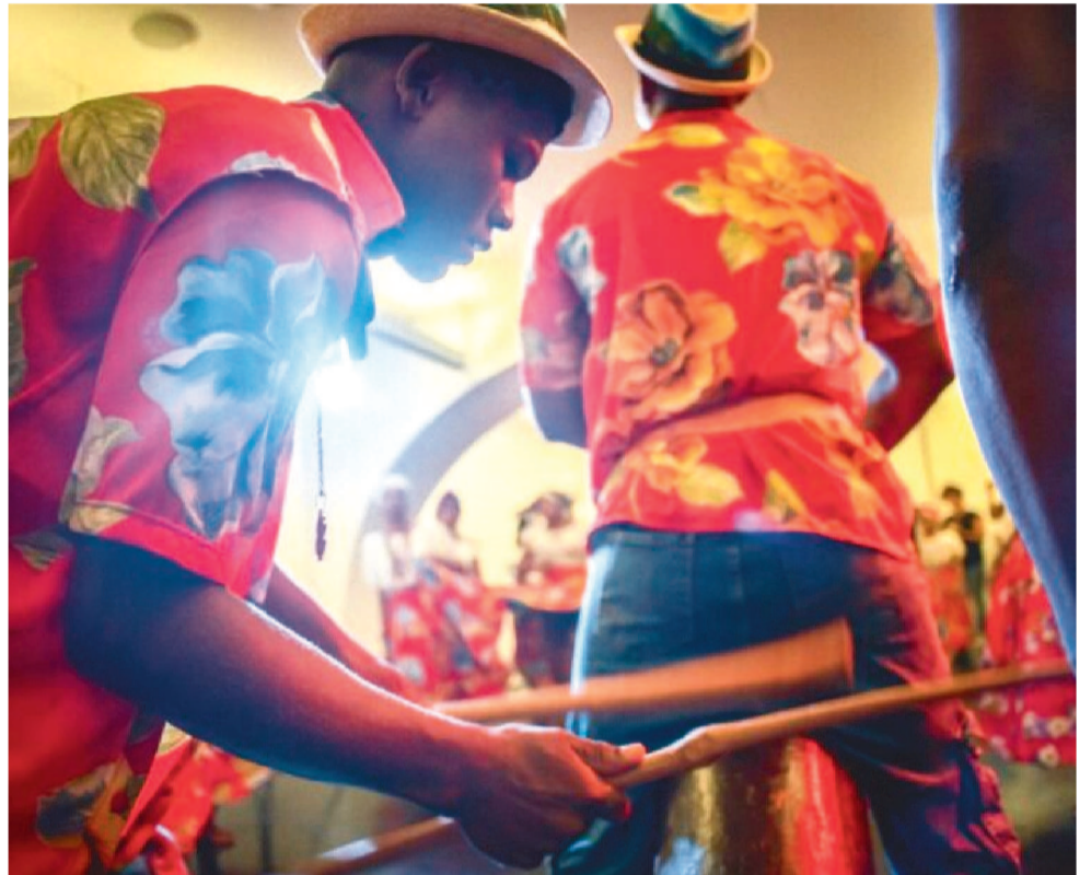
MULHERES E HOMENS TROCAM EXPERIÊNCIAS NO TAMBOR DE CRIOULA

O CCVM é um espaço cultural que oferece e mantém o lugar de diálogo e prática para artistas, produtores de cultura e visitantes. Seu principal objetivo é ampliar o acesso ao fazer e aos bens culturais, proporcionando ambientes de troca, criação e formação, que sejam diversos e de todos.