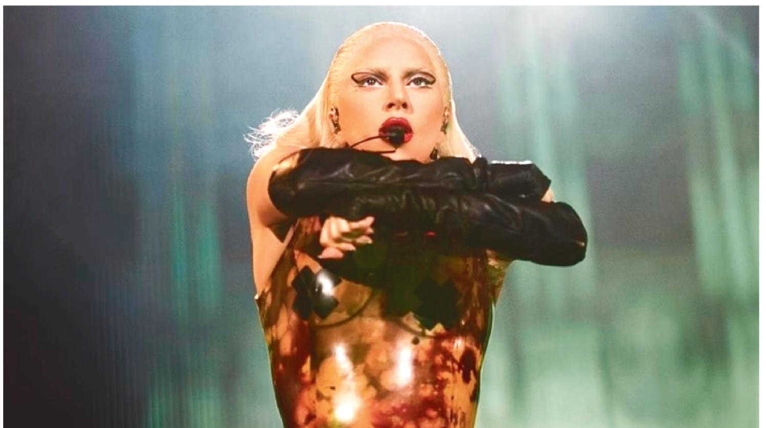
LADY GAGA COMPARTILHOU INFORMAÇÕES IMPORTANTES SOBRE SEUS PRÓXIMOS PASSOS EM UM POST NO SEU INSTAGRAM

Lady Gaga apresentou aos seus fãs nesta terça-feira, 03, pelo seu perfil no Instagram, um pouco do que está por vir nos próximos meses.