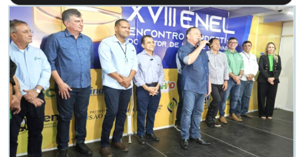
Em sua fala, o governador destacou o potencial da atividade na economia maranhense e reconheceu a importância do trabalho de instituições como o Sebrae e Senar.