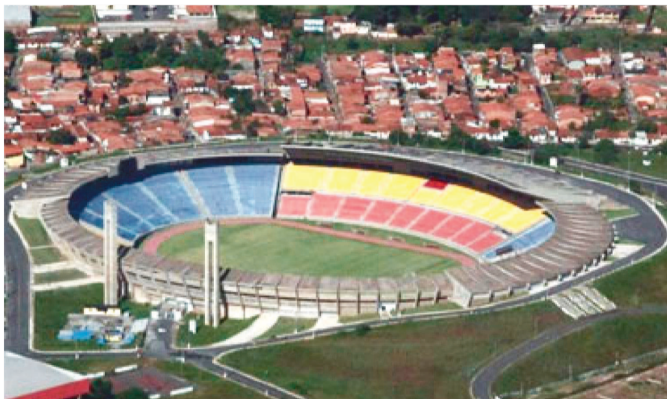
AS PARTIDAS ACONTECEM ENTRE OS DIAS 12 E 19 DE SETEMBRO, NO ESTÁDIO CASTELÃO

Esses temas serão abordados por meio de ações no estádio, apresentações artísticas, palestras, workshops, atividades em aldeias, quilombos, escolas e mais. A publicidade do evento será feita em diversos meios de comu-