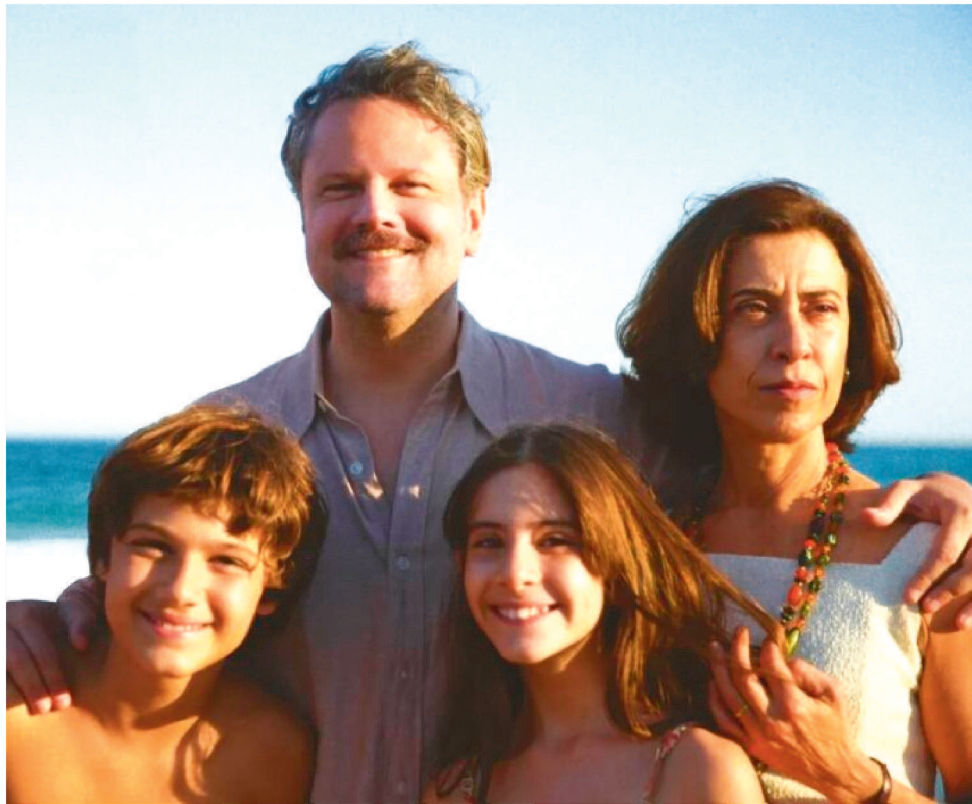
TÍTULOS FORAM ANUNCIADOS PELA ACADEMIA BRASILEIRA DE CINEMA E ARTES VISUAIS

O resultado da escolha do filme que representará o Brasil na categoria Melhor Filme Internacional no Oscar do próximo ano será publicado na próxima segunda-feira (23/9). O filme selecionado será divulgado pela Academia Brasileira de Cinema e Artes Visuais.