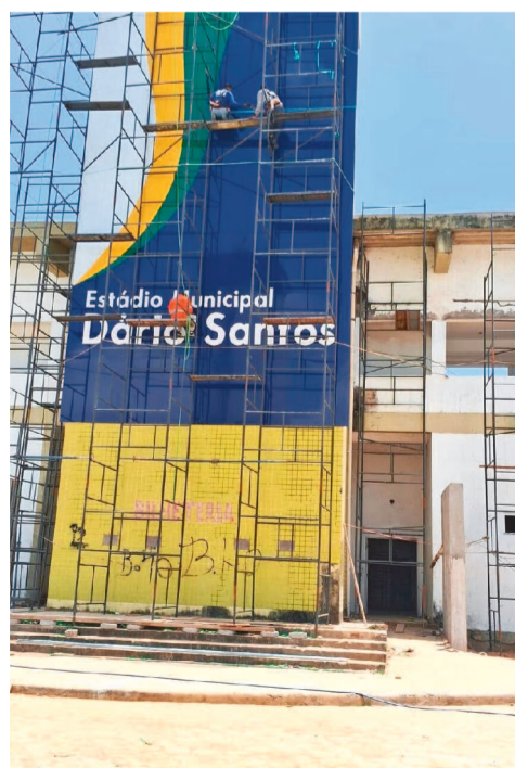
Estádio Dário Santos – Ribamar