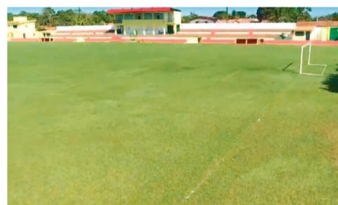
Estádio Biran Miranda – Cantanhede

Mais tarde, foram construídas novas praças esportivas em quase todas as regiões. No Vale do Pindaré, as cidades de Santa Inês e Santa Luzia surgiram como ótimas opções para disputar o Estadual. O Canarinho do Vale foi um dos destaques das competições que participou, e em 2001 sagrou-se vice-campeão maranhense. O Estádio Binezão, com capacidade para 10 mil torcedores, recebia numeroso público e seu gramado era um dos melhores. Em seguida, a cidade passou a ser representada pelo Nacional.