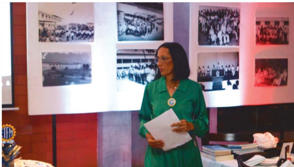
NO ÚLTIMO DIA 23, ACONTECEU O PRIMEIRO GRANDE ENCONTRO

E para falar desse encontro, dessa reunião de amigos, do (re) acendimento de antigas amizades, eu conversei com os ex-alunos organizadores do encontro, e que também foram