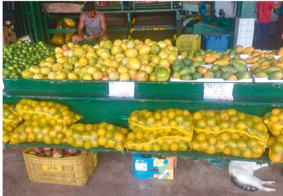
OS PREÇOS NOS MERCADOS AUMENTARAM POR CONTA DESSE FENÔMENO

Tudo isso está deixando apreensivo o mercado de hortifrutigranjeiros. Esta apreensão se deve ao fato do mercado ludovicense importar 80 por cento dos produtos do setor primário, de outros estados. Diariamente, chegam à CEASA de São Luís, dezenas de caminhões com carregamento de frutas e legumes oriundos do Pará, Piauí, Bahia, Ceará, Pernambuco, São Paulo e outros. Até o momento ainda não deu pra notar este problema no mercado de São Luís, a não ser algum produto, considerado sazonal, que apresenta pequenas variações nos preços