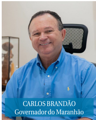
CARLOS BRANDÃO Governador do Maranhão

A Justiça Eleitoral brasileira deu mais uma grande prova de toda a sua capacidade com a realização de mais um período eleitoral grandioso, com medidas robustas que garantem a lisura do processo desde o cadastro dos eleitores até a apuração dos resultados. A urna eletrônica, utilizada desde 1996, se mostrou uma ferramenta eficaz para a consolidação da democracia no país.