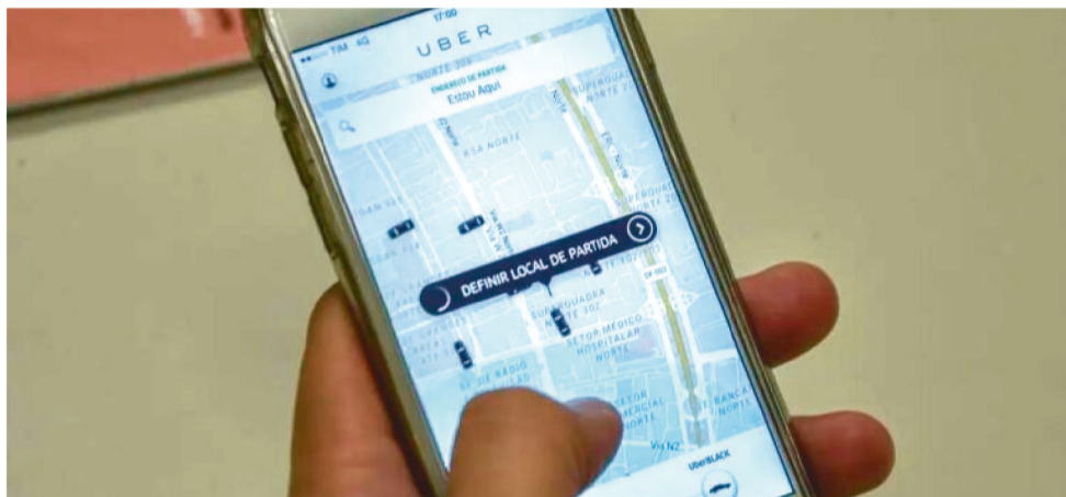
DEVIDO AO RECESSO DE FIM DE ANO NO STF, O CASO DEVE SER JULGADO EM 2025

O principal processo que trata do assunto foi protocolado pelo Uber. A empresa considera inconstitucionais as decisões do Tribunal Superior do Trabalho (TST) que reconheceram a relação de emprego da plataforma