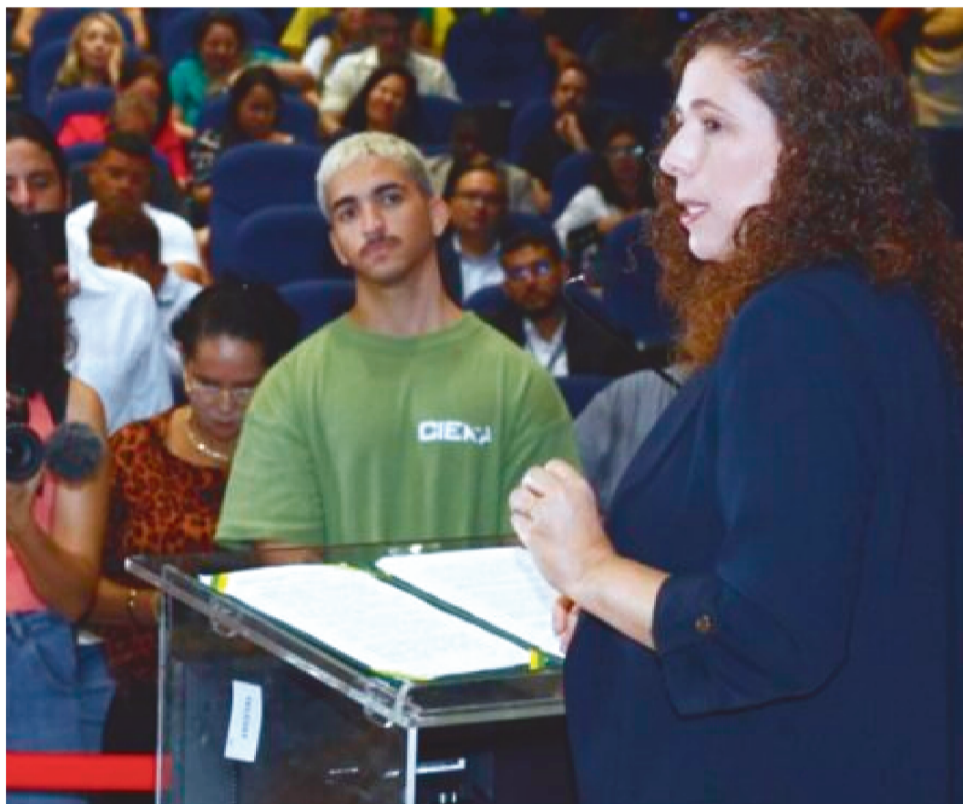
A NOVA ESTRUTURA É RESPONSÁVEL POR ASSEGURAR A PARTICIPAÇÃO POPULAR

A solenidade de implementação do Fórum ocorreu no edifício sede dos Órgãos Regionais do Ministério da Fazenda, em São Luís, com a posse dos 18 membros titulares. Ao longo do evento, que ocorreu na última sexta (18/10), foi reforçada a necessidade de retomada do diálogo participativo e institucional na construção da nova lógica de destinação dos imóveis da União, a ser implementada e reforçada nas reuniões do Fórum.