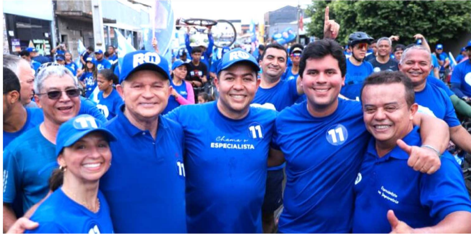
NÚMERO DE ALIADOS NOS 20 MAIORES COLÉGIOS ELEITORAIS DO ESTADO SOBE PARA 17

Com a vitória em Imperatriz, o número de aliados do governador entre os prefeitos dos 20 maiores colégios eleitorais do estado sobe para 17. As únicas exceções são Pinheiro, São José