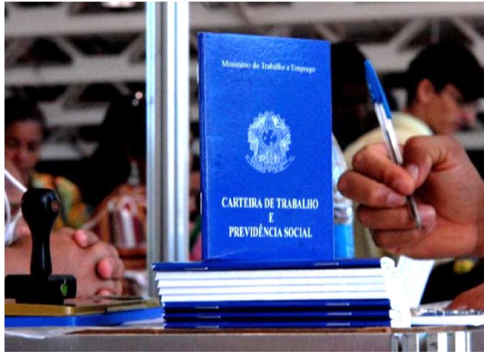
A INDÚSTRIA MARANHENSE FOI RESPONSÁVEL PELA CRIAÇÃO DE 6.678 VAGAS

Nesse intervalo, a indústria maranhense foi responsável pela criação de 6.678 vagas de trabalho formal, o equivalente a 10,4% do que foi registrado na indústria da região. Esse percentual supera a participação maranhense no incremento do emprego em todos os setores na Região Nordeste, que foi de 6,4%. Ressalte-se que, comparativamente com o Nordeste, a indústria maranhense mostrou um desempenho favorável: so-