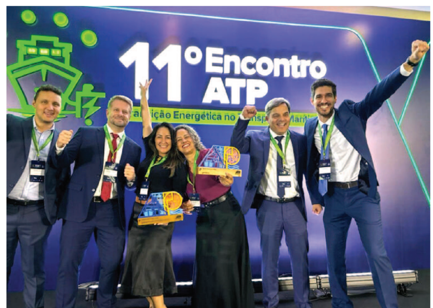
A VLI – companhia de soluções logísticas que opera ferrovias, portos e terminais – foi uma das finalistas do Prêmio ATP, promovido pela Associação de Terminais Portuários Privados (ATP), e foi a grande vencedora da categoria inovação tecnológica portuária, ficando também em segundo lugar na categoria impacto social portuário. A empresa competiu nestas duas categorias avaliadas com o Sistema de Planejamento de Embarque e Desembarque de Navios (Speed), tecnologia que otimiza embarque e desembarque de navios, e com o Projeto Nossa Isca, que capacita e promove geração de renda a pescadores na Baixada Santista. A entrega do prêmio foi realizada na noite desta quinta-feira (24), em Brasília, durante o 11º Encontro ATP.