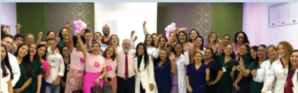
Diretores, colaboradores e palestrantes convidadas para o evento Outubro Rosa no HSE-HSLZ