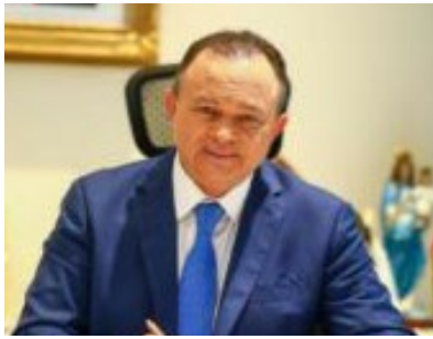
CARLOS BRANDÃO Governador do Maranhão

“ Mais uma vez conseguimos antecipar o pagamento de nossos servidores públicos, graças a uma gestão bem planejada e que tem alcançado ótimos resultados. Ainda em setembro, entregamos o Projeto de Lei Orçamentária Anual (PLOA 2025), elaborado em plena consonância com as metas e estratégias delineadas no Plano Plurianual 2024-2027 e no primeiro plano estratégico de longo prazo do estado, o Plano Maranhão 2050.