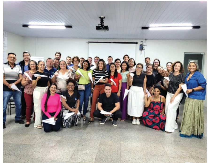
O encontro presencial abordou temas relacionados à gestão ágil, com foco em práticas que possam melhorar os processos internos das empresas, aumentar a produtividade e gerar resultados mais eficientes