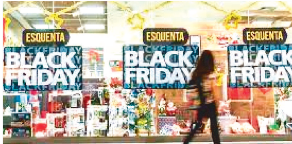
HOUE UM AUMENTO EXPRESSIVO ENTRE OS ESTADOS BRASILEIROS POR BUSCAS

A pesquisa ainda apontou quais setores são mais procurados em cada região, revelando tendências de consumo e os itens mais desejados para este ano. A expectativa é de que o volume de compras seja ainda maior do que em 2023, e isso se reflete pelas