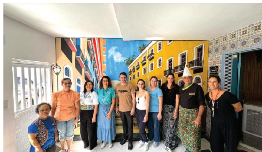
Experiência cultural e gastronômica marcou o início do Famtour, promovendo o turismo de base comunitária e a cultura maranhense

O Grupo Potiguar lançou uma super campanha de prêmios, a Compra Premiada Potiguar que já começou e vai até o dia 01 de fevereiro de 2025, com sorteio final no dia 02/02/25. Até lá, todos os clientes podem participar da campanha que vai sortear prêmios valiosos e o melhor, úteis e sustentáveis. No total, envolvendo todas as dez lojas do Grupo em São Luís, Santa Inês, Bacabal e Imperatriz, serão sorteados 5 carros elétricos da BYD; 10 motocicletas elétricas; 10 iPhones modelo 15 Pro Max no sorteio principal. E mais, todos os sábados, em cada uma das 10 lojas participantes, também serão sorteados semanalmente 1 Vale Compras de R$ 500,00 cada. Detalhe: Os ganhadores dos vales compras semanais continuarão concorrendo ao sorteio final dos prêmios principais. O primeiro desses sorteios semanais acontece nesse sábado (09.11) pela manhã, em cada uma das 10 lojas do Grupo Potiguar. E o cliente poderá participar dos sorteios semanais comprando e depositando seu cupom na urna da loja, até meia hora antes da realização do sorteio, no mesmo dia.