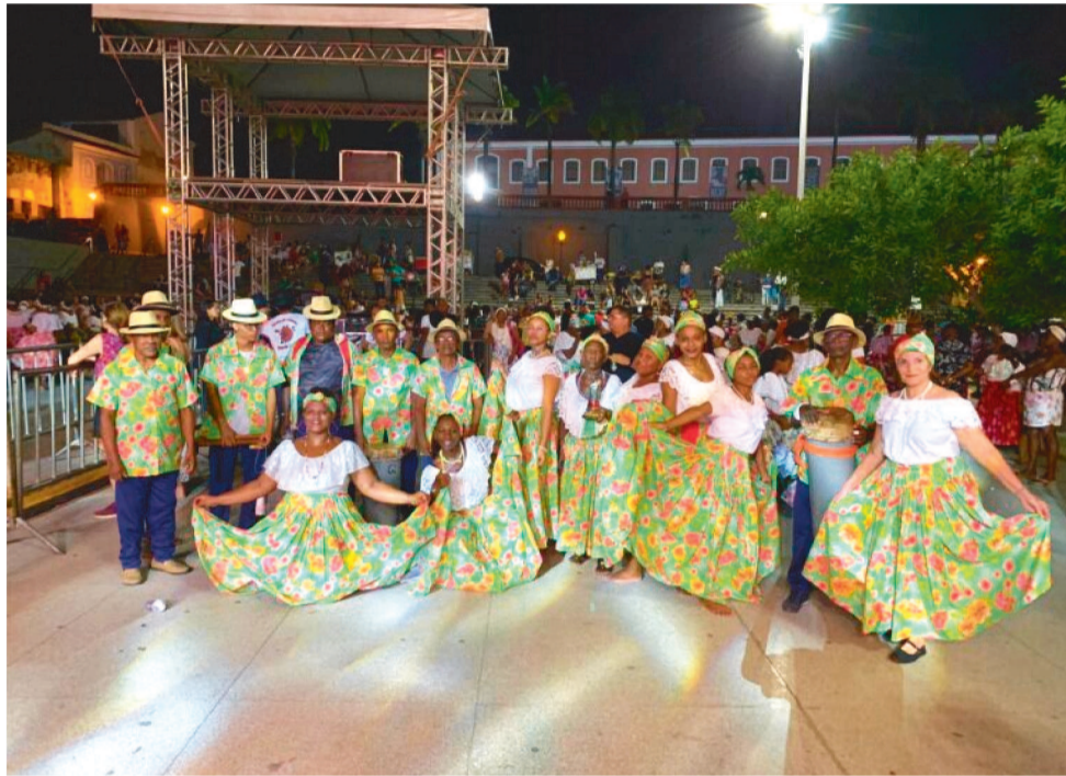
AS DUAS APRESENTAÇÕES TÊM ENTRADA GRATUITA, NO PÁTIO ABERTO DO CCVM

Fundado em 1976 no bairro Coroadinho, o Tambor de Mestra Analice tem – entre os instrumentos de sua parrelha – a matraca, tradicionalmente usada no Bumba Meu Boi. O “Carinho de São Benedito” tem mais de vinte integrantes, entre batuqueiros, matracqueiros, coreiras e cantadores.