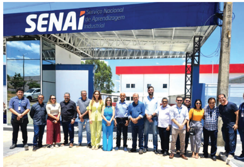
O SENAI Balsas, em parceria com o Governo do Estado e outras instituições, já qualificou cerca de 500 profissionais para a Inpasa, com mais de 300 matrículas em andamento, totalizando 800 vaga