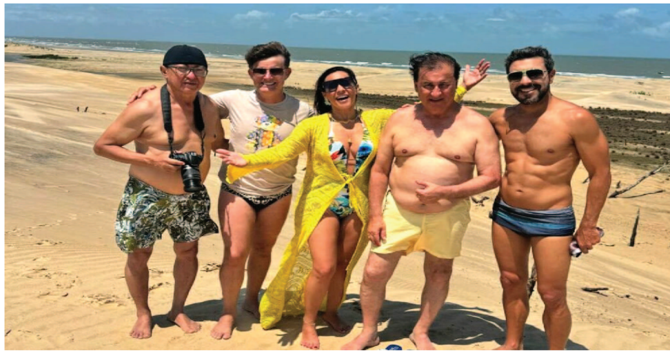
OS ARTISTAS SE ENCANTARAM COM OS ATRATIVOS DE RAPOSA