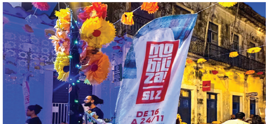
O CENTRO DE SÃO LUIS RECEBEU FEIRAS COM EMPODERAMENTO FEMININO

As ações fizeram parte da extensa agenda de atividades da 4ª edição do Mobiliza SLZ, evento promovido pelo Sebrae-MA para fomentar o turismo, a cultura e a economia criativa na capital, de 16 a 24 de novembro.