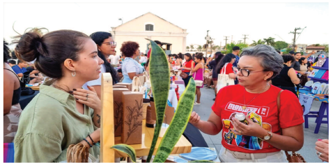
FEIRA ENCONTRO DE BRECHÓS

No mês em que se celebra o Dia Mundial do Empreendedorismo Feminino, comemorado em 19 de novembro, a cidade de São Luís recebeu quatro iniciativas que apoiam a mulher empreendedora: a "Feira Encontro de Brechós", a "Expo Angelim", a "Expo Lojas SLZ" e o "Mercado Mi-