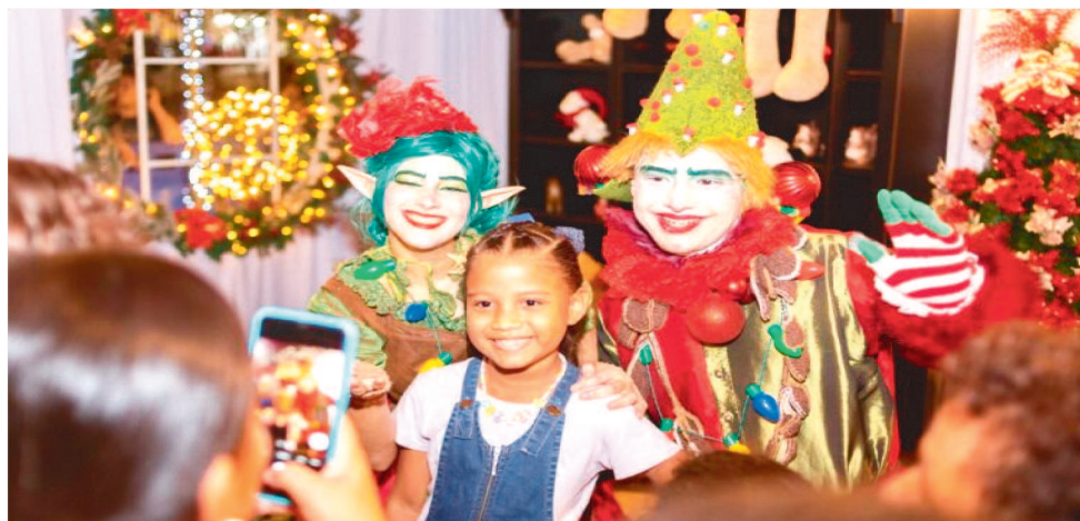
NATAL DA FAMÍLIA ITINERANTE VAI LEVAR ATRAÇÕES NATALINAS A VÁRIOS BAIRROS

“O Natal vem com muitas novidades, muitas atrações, programações temáticas para todos os gostos e público de todas as idades. O Governo do Estado está preparando tudo para