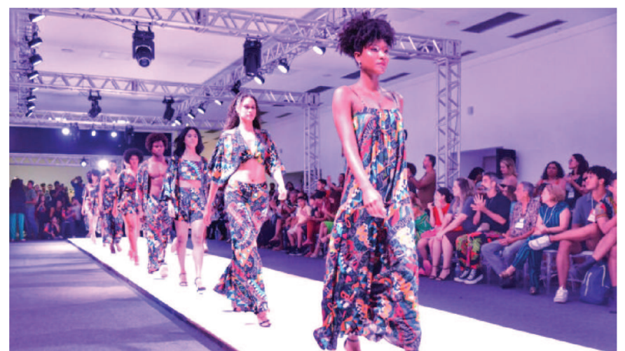
Uma feira muito bonita e que mostrou a força do setor do vestuário no Maranhão