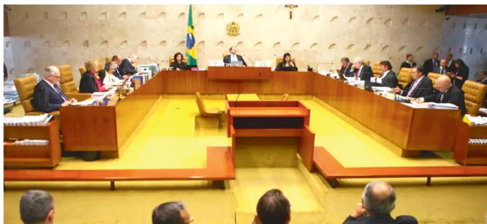
CORTE TEM SEIS DOS 11 VOTOS DO PLENÁRIO PARA REJEITAR UM RECURSO DO MPF

Prevalece no julgamento virtual o voto do relator, ministro Cristiano Zanin. O ministro ressaltou que o cristianismo faz parte da formação da sociedade brasileira e que os feriados alusivos à religião, os nomes de cidades, estados e locais públicos fazem parte