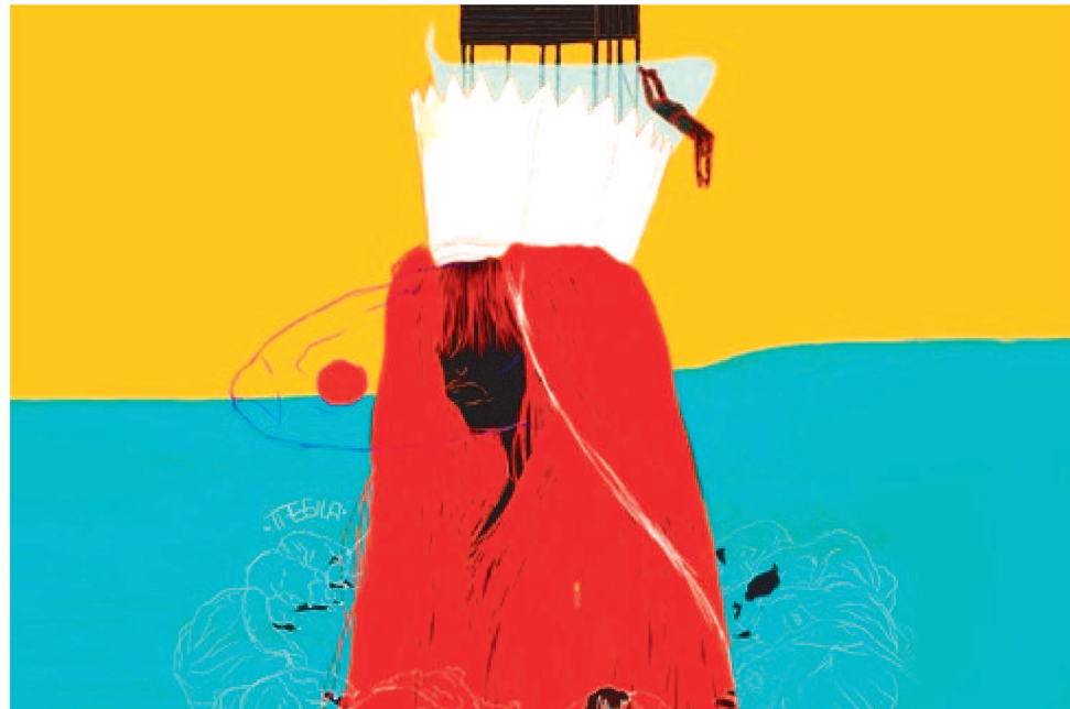
O DRAMATURGIAS NEGRAS É UMA INICIATIVA DA CIA CHÃO DE COZINHA

Aprovado no Edital Ocupa CCVM – Amazônia em Foco 2024, o Dramaturgias Negras é uma iniciativa da Cia Chão de Cozinha, um espaço artístico composto por pessoas pretas, que pensam seus trabalhos autorais a partir da escrita dramática como um movimento emancipatório, na ideia