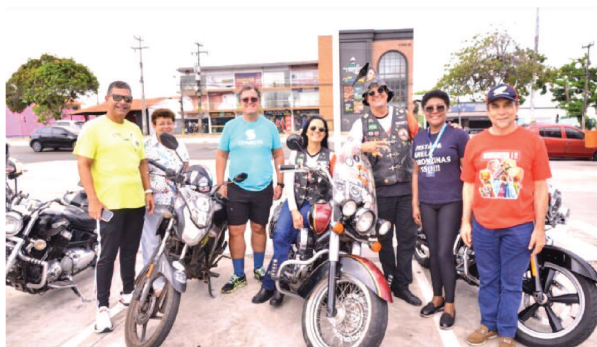
A Expo Mecânica Maranhão 2024 reunirá importantes representantes do setor automotivo regional, incluindo indústrias, representantes de estabelecimentos comerciais e prestadores de serviços

Poeta premiado internacionalmente, Salgado Maranhão reforça o valor da poesia brasileira ao ocupar a Cadeira nº 7, em cerimônia marcada por homenagens e reconhecimento. Salgado Maranhão, nome artístico de José Salgado Santos, nasceu em Caxias (MA) e é um dos grandes nomes da poesia brasileira contemporânea. Ainda jovem, migrou para Teresina, onde se apaixonou pela literatura lendo autores como Camões, Gonçalves Dias e Fernando Pessoa. Em 1972, foi incentivado por Torquato Neto a seguir para o Rio de Janeiro, onde consolidou sua carreira.