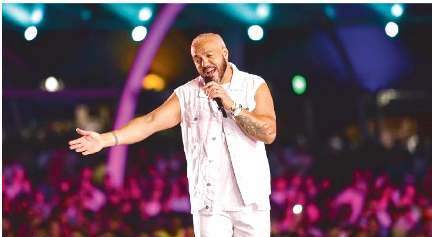
O ARTISTA FARÁ SHOW EM SÃO LUÍS, DIA 28 DE DEZEMBRO AO LADO DOS CANTORES DIEGO FACÓ E KARENZINHA

Pela primeira vez, o palco do Fantástico recebeu o cantor Belo, na edição do último domingo (24). O artista estreia um documentário sobre a sua carreira no Globoplay no dia 28/11, e em conversa com Poliana Abritta, também falou sobre os primeiros passos como ator na terceira temporada de “Arcanjo Renegado”, que está no ar no Globoplay.