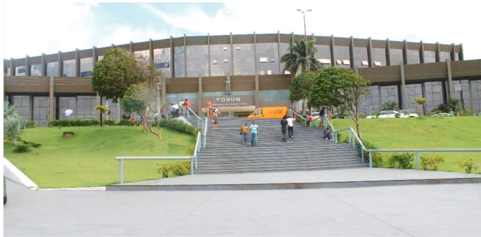
OS JULGAMENTOS SERÃO NOS SALÕES LOCALIZADOS NO FÓRUM DES. SARNEY COSTA