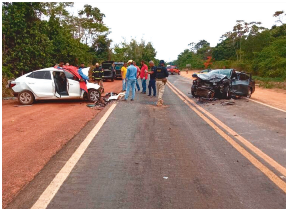
O ACIDENTE OCORREU NA ALTURA DO KM 653 DA BR-222, NA CIDADE DE AÇAILÂNDIA

pista de rolamento e no acostamento, onde deixaram o trânsito lento. A grave ocorrência foi atendida por uma equipe da PRF em Açailândia.