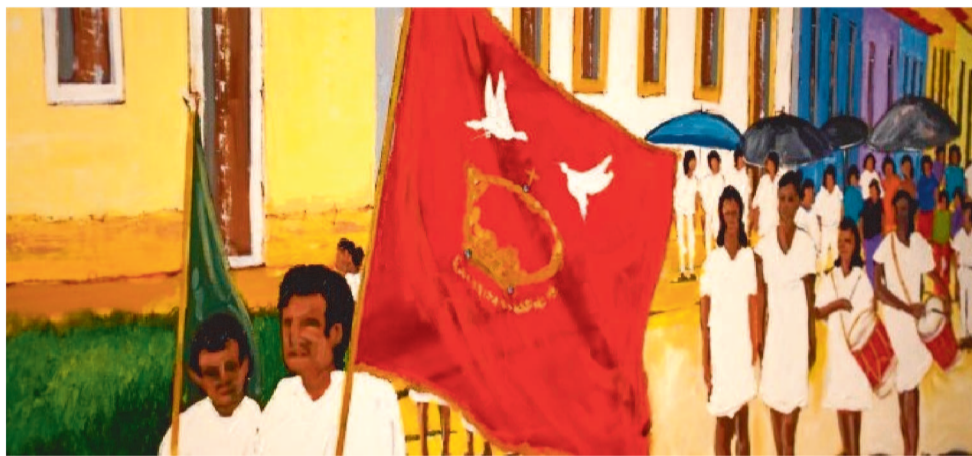
MOSTRA PROMETE EXPERIÊNCIA REPLETA DE ARTE, HISTÓRIA E IDENTIDADE CULTURAL

Segundo o artista, a exposição é um reflexo de sua profunda conexão com a arte. "A arte é tudo. Ela é uma emoção, uma alegria. Eu tenho um amor muito grande pela arte. Logo que cheguei a São Luís, em 1978, comecei a trabalhar em uma loja de molduras e