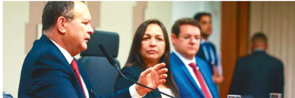
GOVERNADOR CARLOS BRANDÃO E A SENADORA ELIZIANE GAMA

“Desde que assumi o governo, participo desta reunião com a bancada maranhense, na reta final do ano, para apresentar projetos que já temos prontos para serem executados e que dependem apenas de recursos. Os parlamentares são livres para destinarem suas emendas para as ações que