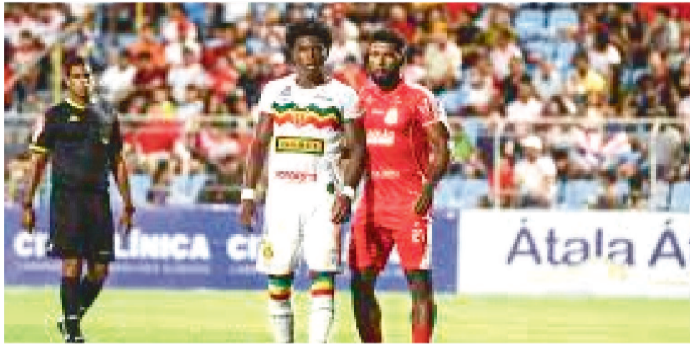
IMPERATRIZ E SAMPAIO CORRÊA FAZEM A PARTIDA DE ABERTURA DO CAMPEONATO

Maranhense de 2025 será disputado às 19h30, do dia 11 de janeiro, no Estádio Frei Epifânio, em Imperatriz. O Cavalão recebe o atual campeão Sampaio Corrêa.