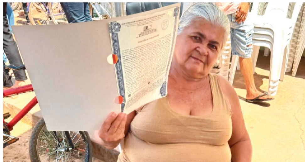
AÇÃO FAZ PARTE DA SEMANA NACIONAL DE REGULARIZAÇÃO FUNDIÁRIA DO CNJ

A Semana aconteceu de 25 a 29 de novembro, nos nove estados que compõem a Amazônia Legal: Amazônia, Roraima, Rondônia, Pará, Maranhão, Tocantins, Acre, Amapá e Mato Grosso. No Maranhão, a aplicação da política Regularização Fundiária Urbana (Reurb) reafirma o compromisso das instituições de Justiça em transformar realidades e promover equidade social. As entregas realizadas durante a semana são um marco