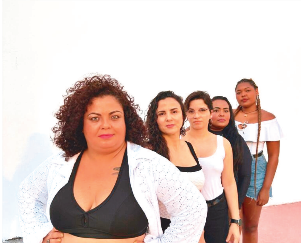
COMPOSTO APENAS POR MULHERES, O GRUPO SE APRESENTA NESTA QUINTA-FEIRA (05)

O Samba Pequena vai trazer muita alegria por meio da memória afetiva proporcionada por canções que contam a história do Maranhão. É nesta quinta-feira (05), às 19h.