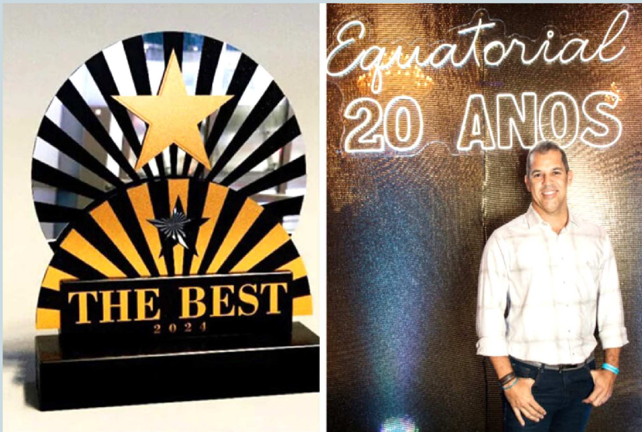
The Best 2024 realiza edição especial para homenagear marcas tradicionais do Maranhão com mais de 20 anos de atuação, como a Equatorial Energia