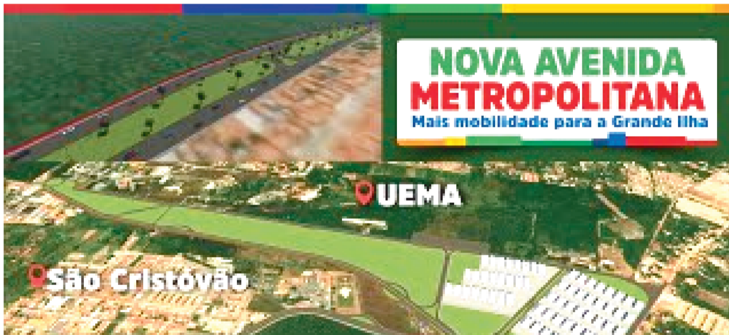
50 BAIRROS DOS QUATRO MUNICÍPIOS DA ILHA: SÃO LUÍS, S.J DE RIBAMAR, PAÇO DO LUMIAR E RAPOSA SERÃO INTERLIGADOS

Com mais de 10 quilômetros de extensão, a Avenida Metropolitana – também chamada de Corredor Metropolitano – vai interligar 50 bairros dos quatro municípios da Ilha. A via será um novo anel viário da Grande Ilha, promovendo a integração de 1 milhão de pessoas de São Luís, São José de Ribamar, Paço do Lumiar e Raposa.