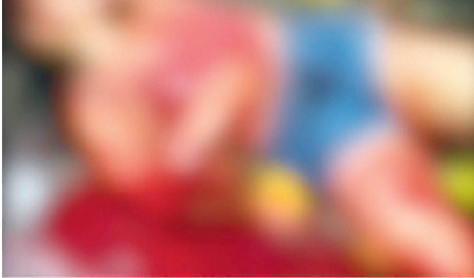
POLÍCIA INVESTIGA O CASO E FAZ BUSCAS PARA PRENDER A SUSPEITA DO CRIME

Uma mulher, que ainda não teve a identidade revelada, foi esfaqueada durante uma festa na cidade. A autora do crime teria levado uma faca escondida na roupa que usou na festa.