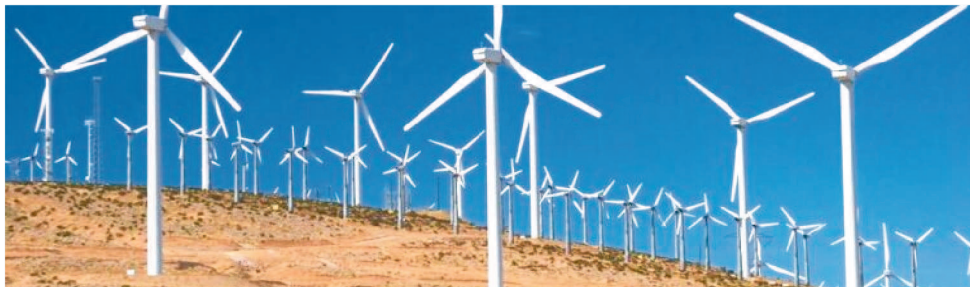
TEXTO AINDA PREVÊ PRORROGAÇÃO ATÉ 2050 DOS CONTRATOS DO GOVERNO FEDERAL

Além das perdas de arrecadação para os estados, estimadas por representantes do setor em mais R$ 5 bilhões para as plantas no período de 15