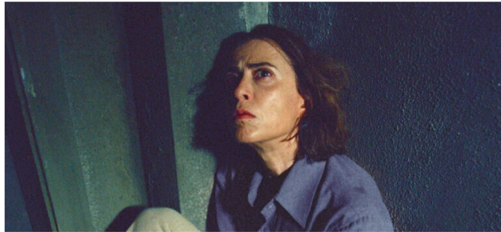
ATRIZ FOI INDICADA PELO TRABALHO NO FILME AINDA ESTOU AQUI, DE WALTER SALLES

Além de Fernanda Torres e Fernanda Montenegro, a atriz Sonia Braga