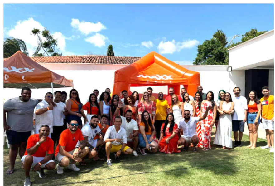
Diretores e colaboradores da operadora Maxx se reuniram para celebrar as conquistas e inovações do ano de 2024.