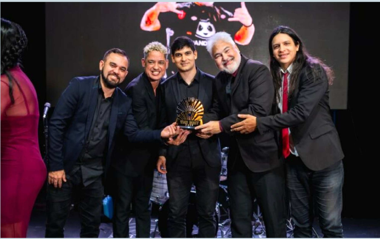
Uma das bandas mais requisitadas para shows na noite e grandes eventos de São Luís, Pandha S/A, foi eleita pelos seguidores do Blog do Ned, a Atracção Artística do Ano, na premiação The Best 2024. Após a homenagem, a banda brindou o público presente com um belíssimo show que foi até altas horas