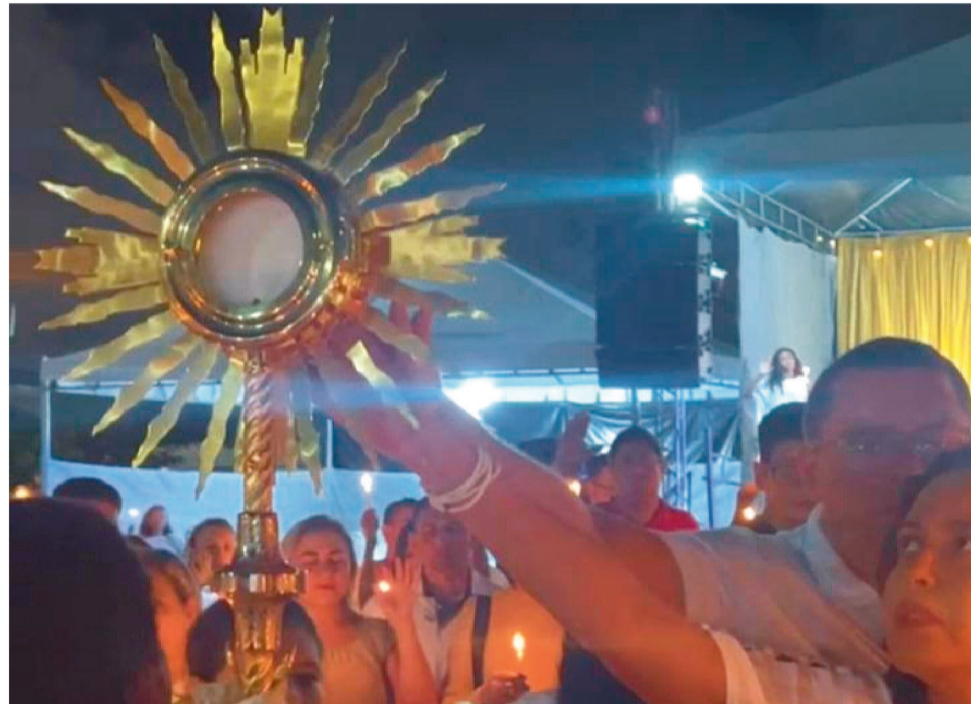
HAVERÁ A GRANDE VIGÍLIA DA VIRADA QUE SERÁ REALIZADA PELA IGREJA UNIVERSAL