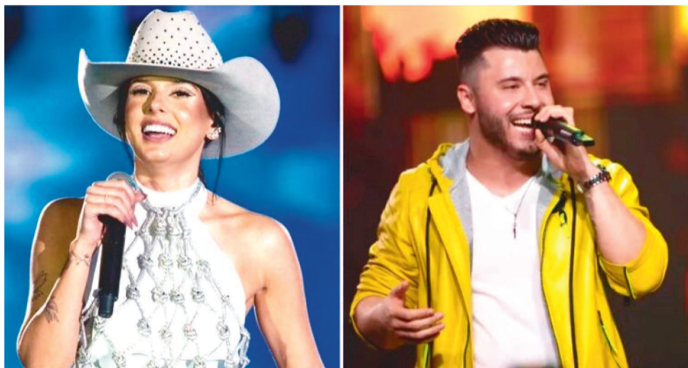
ANA CASTELA E MURILO HUFF SÃO GRANDES ATRAÇÕES NO RÉVEILLON DE SÃO LUÍS