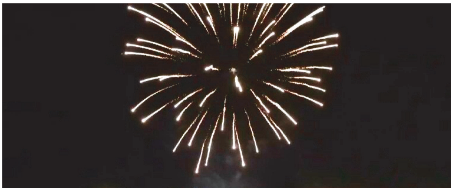
UMA DAS PRINCIPAIS ORIENTAÇÕES PARA A POPULAÇÃO ESTÁ O NÃO MANUSEIO DOS ARTEFATOS DIRETAMENTE COM AS MÃOS