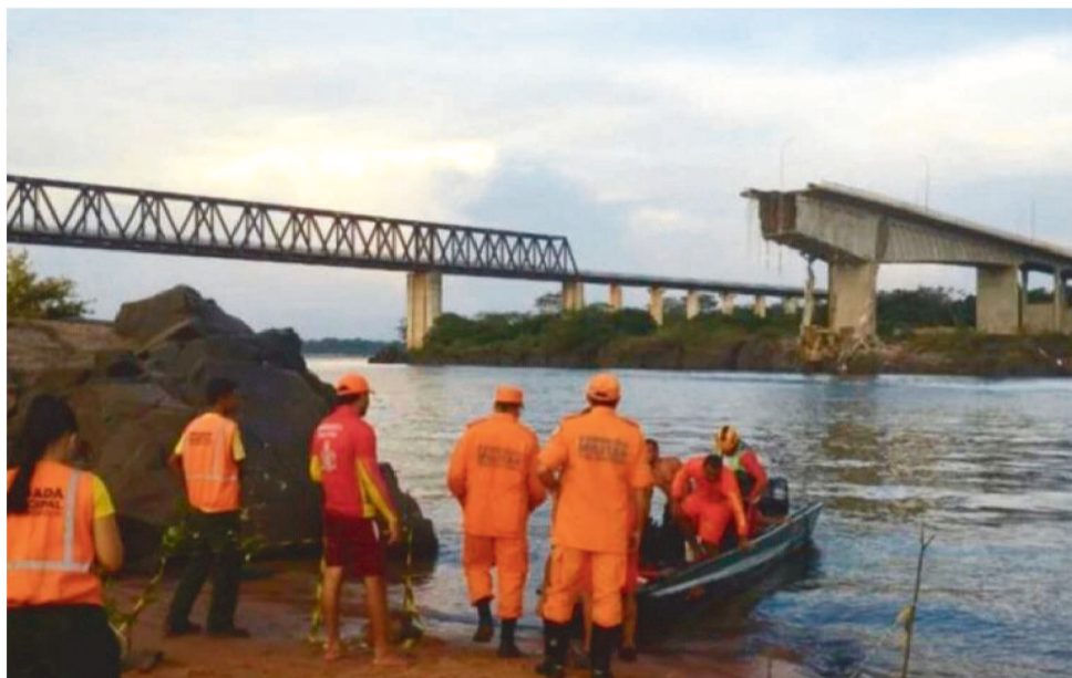
MERGULHADORES RETIRARAM DO RIO UM CORPO QUE ESTAVA PRESO EM UM VEÍCULO

No período da tarde, um drone subaquático identificou a localização de um veículo de passeio, a 44 metros de