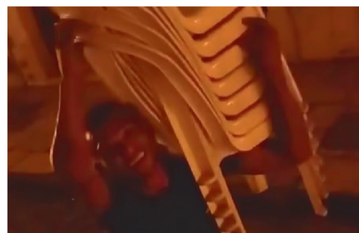
MESAS E CADEIRAS FORAM LEVADAS