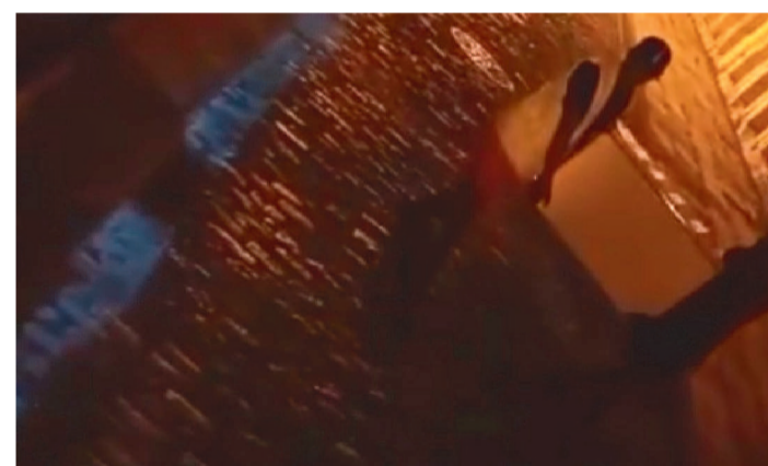
UM FRIGOBAR TAMBÉM FOI FURTADO PELOS SUSPEITOS