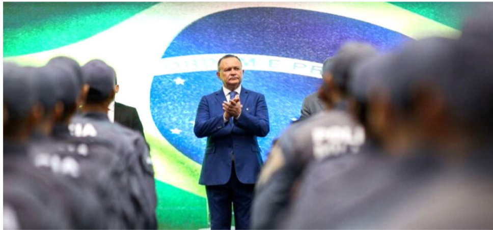
LISTA COMPLETA DOS NOMEADOS ESTÁ DISPONÍVEL NO DIÁRIO OFICIAL DO ESTADO

O secretário de Estado da Segurança Pública, Maurício Martins, também pontuou a importância do fortalecimento do efetivo. “A nomeação de novos policiais militares reflete o compromisso do governador Carlos Brandão com a segurança pública. Trata-se de mais um importante in-