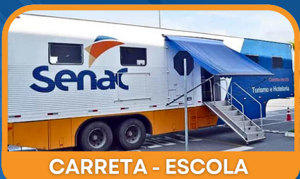
CARRETA - ESCOLA