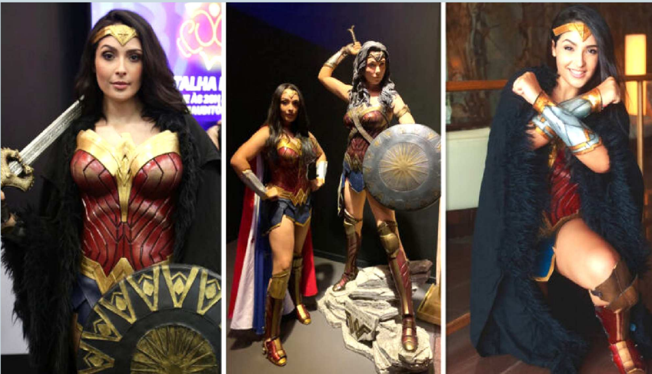
Muito esperado pelos fãs do universo geek, o concurso de cosplay está agendado para às 17 horas, na Área de Vivência