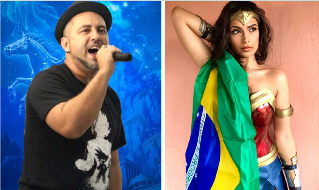
O cantor e intérprete oficial de CDZ (Cavaleiros do Zodíaco), Will Kamamura comemora 30 anos de Cavaleiros dos Zodíacos no Brasil