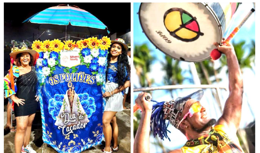
A noite do samba de batucada do bloco Os Foliões promete fazer a união do reggae com o samba-reggae: o grupo cultural Bloco Afro Olodum será homenageado

Foto Sombra e franqueado da marca de perfumaria e cosméticos Mahogany, que trouxe para São Luís há 15 anos, com três lojas em São Luís e uma em Imperatriz. A experiência como gestor de uma empresa de pequeno porte vai contribuir para que possa entender melhor os interesses dos empresários do setor e debater propostas que possam fortalecer esse segmento empresarial. Fundada há 170 anos, a Associação Comercial do Maranhão é uma das entidades empresariais mais tradicionais do Brasil, com uma trajetória que se confunde com a história do comércio no estado. Entre suas principais metas, a ACM/MA busca fortalecer a classe empresarial, defender os interesses dos setores produtivos e atuar como catalisadora do desenvolvimento econômico e social. A entidade também pretende ampliar parcerias, promover o crescimento empresarial e oferecer atendimento técnico especializado aos seus associados.