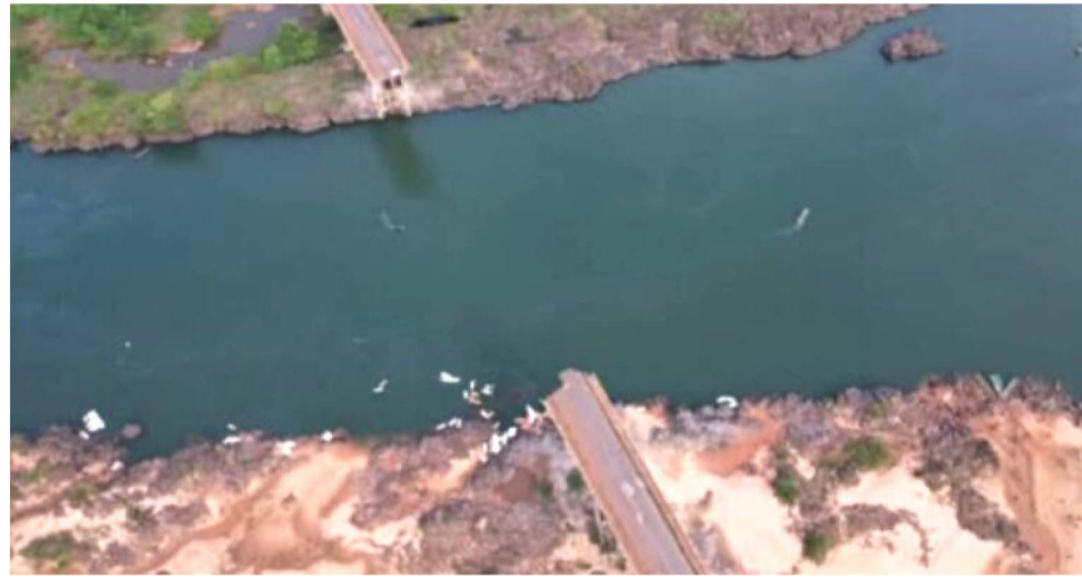
PONTE JUSCELINO KUBITSCHKEK DESABOU NA TARDE DO DIA 22 DE DEZEMBRO DE 2024

Inaugurada em 1970, a ponte era um importante ponto de ligação entre os estados, sendo fundamental para o transporte de mercadorias e pessoas. Nos últimos anos, motoristas e moradores haviam relatado problemas estruturais, como rachaduras e desgases,