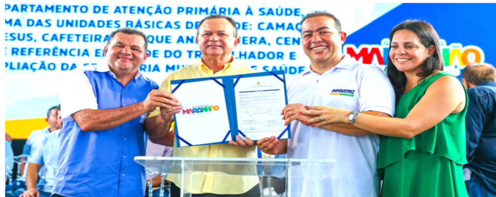
CARLOS BRANDÃO TAMBÉM FIRMOU PARCERIAS E CONVÊNIOS COM A PREFEITURA

O governador Carlos Brandão também visitou as obras da futura escola especializada em pessoas com Transtorno do Espectro Autista (TEA), em construção na cidade. Em seguida ele se reuniu com o prefeito Rildo Amaral,