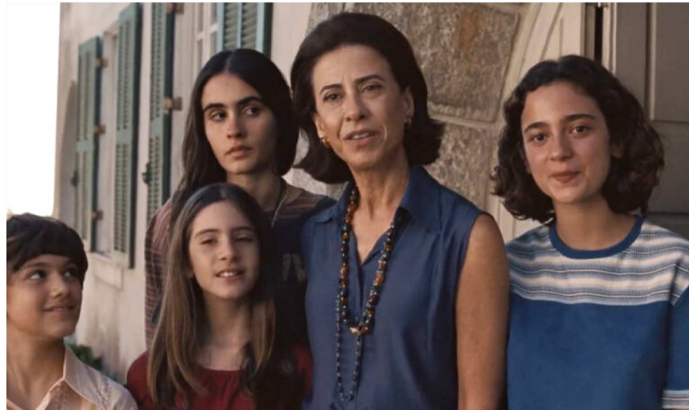
FILME DISPUTA AINDA COMO MELHOR FILME INTERNACIONAL E MELHOR ATRIZ, COM FERNANDA TORRES

A produção de Walter Salles está presente, portanto, em três categorias da premiação da Academia, o segundo maior número de indicações para um filme totalmente brasileiro — atrás apenas de Cidade de Deus , que