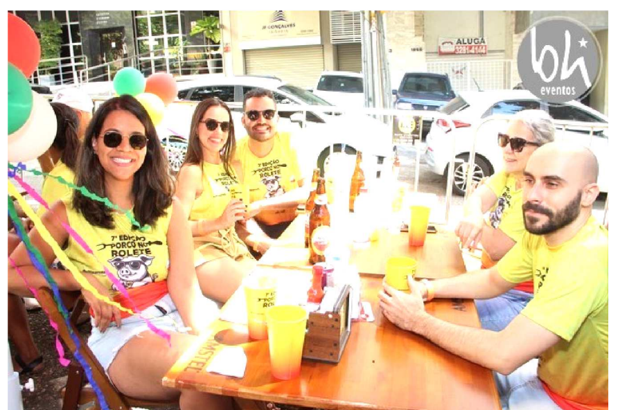
A nova geração da sociedade mineira também prestigiou o badalado evento